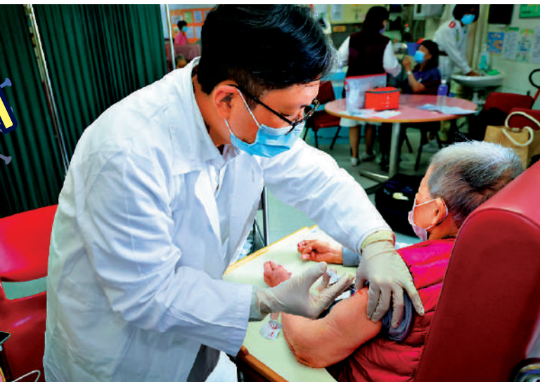
▲全港累計逾八成安老院舍出現感染個案，有議員認為明知無打針長者染疫死亡率較高，應考慮強制長者打針。

本港昨日新增31008宗確診，衛生防護中心傳染病處首席醫生歐家榮表示，儘管過去兩天新增個案稍減，但確診數字仍處高位。政府現階段未能判斷第五波疫情是否見頂或確診個案會否再增加，須觀察至少一至兩周才可確認，市民仍須保持警覺。