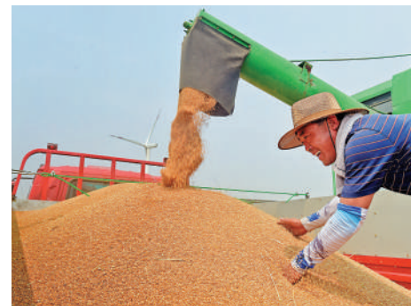
▲去年，河北黃驊市依託農業科技部門，推廣種植適合鹽鹼地的早熟麥20餘萬畝，實現豐收。

文說，總書記的「插話」，讓他印象很深。委員發言時，總書記不時追問，一些具體數據信手拈來，說明他對相關情況很了解。「簡單的問答，一下拉近了國家領導人和委員的距離」。