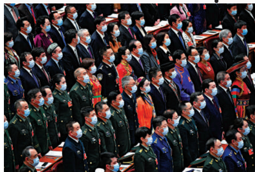
▲3月5日，十三屆全國人大五次會議在北京人民大會堂開幕。

中共中央政治局委員、中央軍委副主席許其亮主持會議，中共中央政治局委員、中央軍委副主席張又俠，中央軍委委員魏鳳和、李作成、苗華、張升民參加會議。