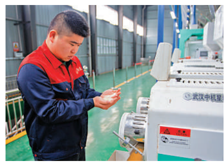
▲湖南常德市一生態農業科技公司工作人員在生產車間抽查大米品質。

化變成無糧化！「必須保持自主性，保證一個可控的自給量、自給率。」有人說，國際上貨源充足，種不如買。「說得很輕巧。土地現在不種大豆，不種玉米，不種棉花，到時候國際市場不好了咱們再種過來，談何容易啊！沒有三五年能轉過來嗎？」