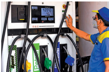
▲在俄烏戰事持續下，油價可能升破歷史高位。