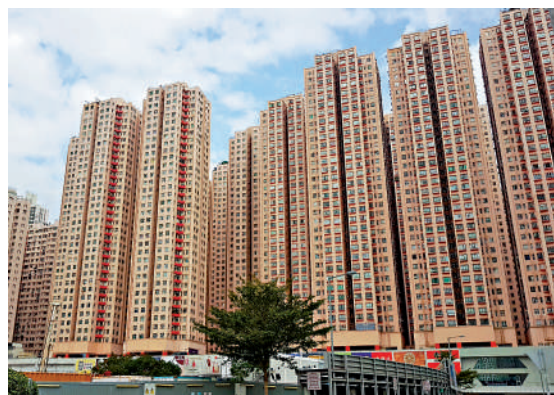
▲牛頭角淘大花園今年至少已錄得5宗損手成交。