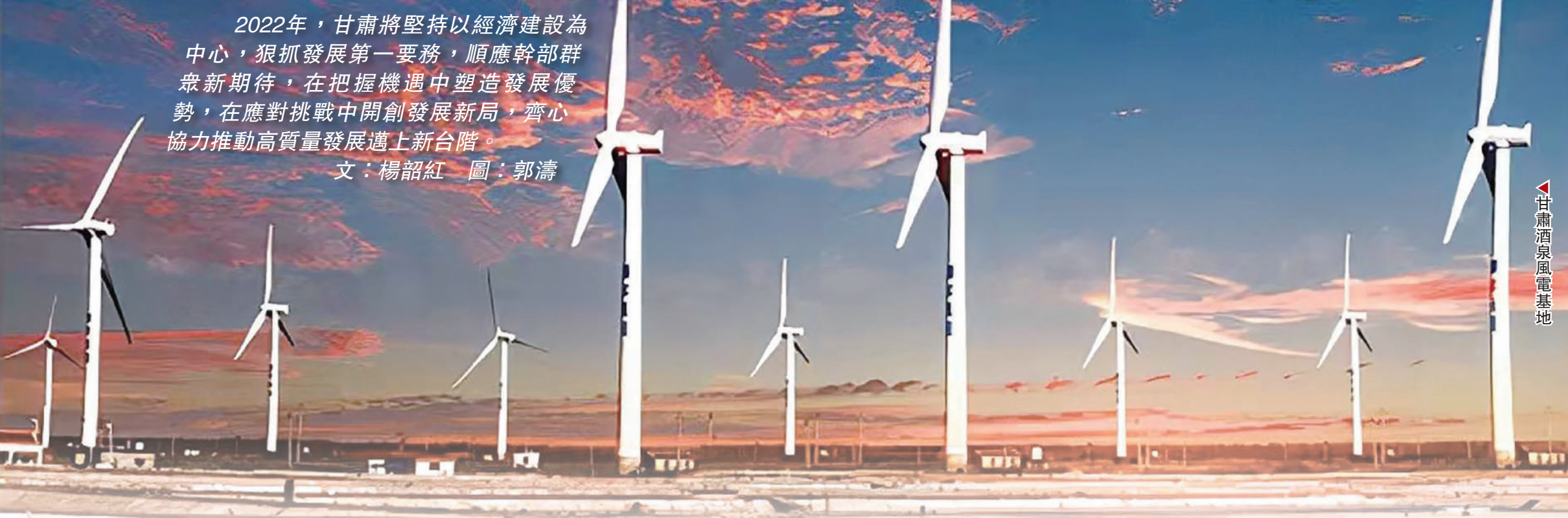
甘肅酒泉風電基地

2021年甘肅全省地區生產總值首破萬億元（人民幣，以下均為人民幣），達10243億元；一般公共預算收入超千億元，達1001.8億元。