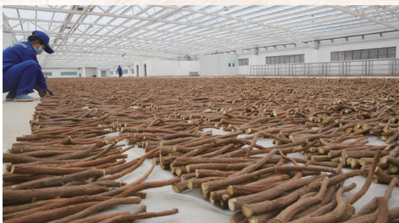
▲西北最大紅皮甘草晾曬加工基地——甘肅琦昆農業發展有限公司的晾曬加工現場

點項目，打造新能源及配套產業，不斷增強工業對經濟發展的支撐作用。實施創新驅動發展戰略，以強科技行動為牽引，加快科技創新平台建設，提高重大科技項目的組織力，強化企業創新主體地位，加大科研經費投入力度，加快科技成果轉化應用，着力增強高質量發展的科技支撐力。着力實施強省會行動和強縣域行動，增強城市經濟創新活力和發展能級，大力推進以人為核心的新型城鎮化，打造區域經濟增長極，推動形成全省發展新優勢。