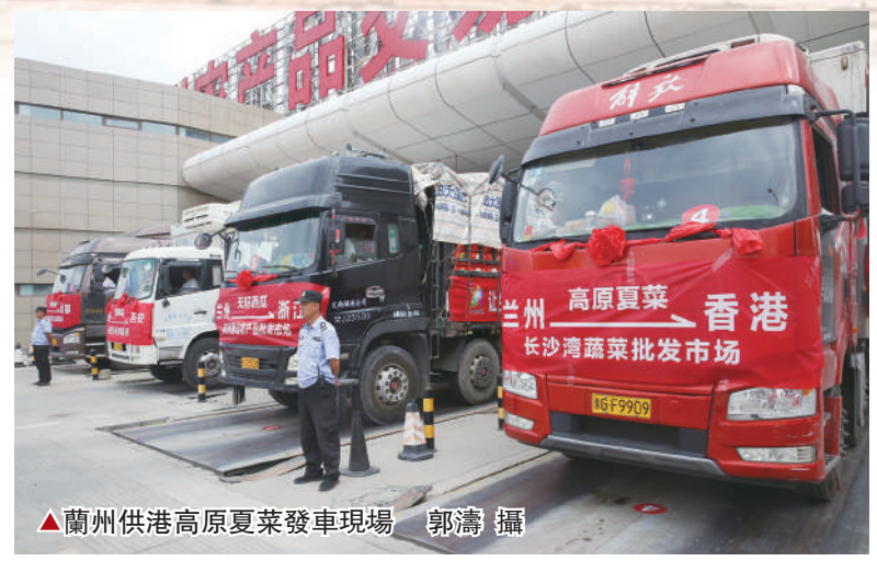
▲蘭州供港高原夏菜發車現場

尹弘要求全省要圍繞甘肅省委十三屆十五次全會提出的目標，始終堅持以人民為中心，樹立正確政績觀，結合實際創造性地開展工作，激發廣