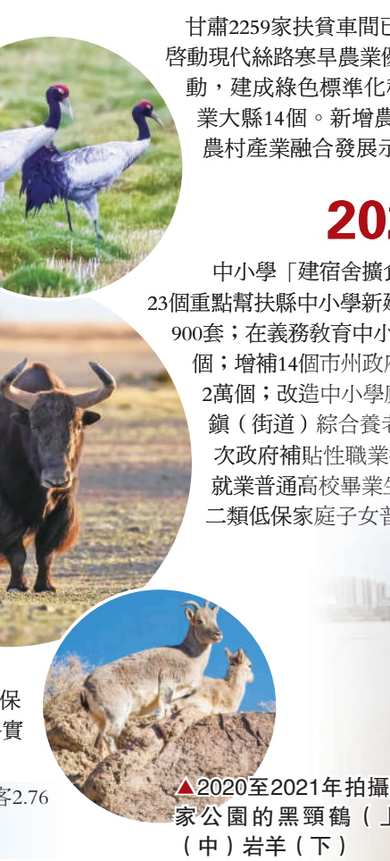
▲2020至2021年拍攝於祁連山國家公園的黑頸鶴（上）野驢牛（中）岩羊（下）

新增11個國家4A級旅遊景區。接待國內外遊客2.76億人次，實現旅遊綜合收入1842億元。