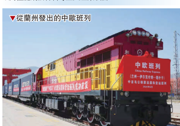
▲從蘭州發出的中歐班列

開工建設寶武碳業10萬噸負極材料、海亮集團15萬噸高性能銅箔材料等重大產業項目。