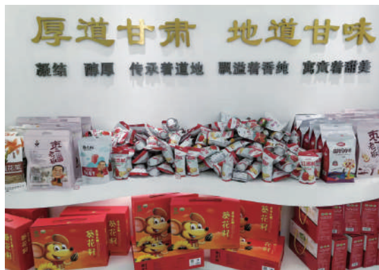
▲「甘味」品牌展示中心

尹弘強調，要認真貫徹落實「三新一高」導向，大力實施強工業、強科技、強省會、強縣域行動，統籌經濟與生態、城市與鄉村、發展與安全，努力在構建新發展格局中贏得先機主動，在高質量發展中實現爭先先進。實施強工業行動，加快構建現代產業體系，圍繞強龍頭、補鏈條、聚集群，一手抓傳統產業改造升級，一手抓新興產業培育壯大，謀劃實施一批延鏈補鏈強鏈重