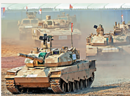
▲中國合理確定國防支出規模。圖為中國航展上進行的地面裝備動態展示。 資料圖片