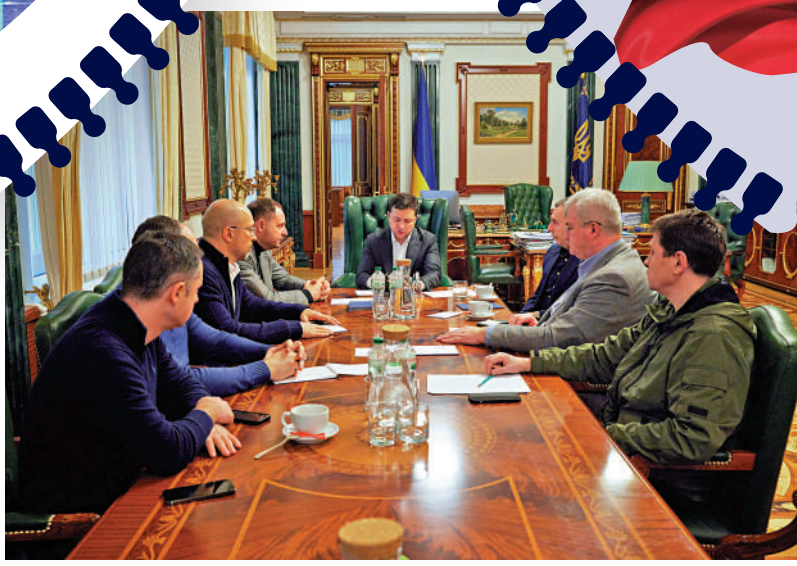
▲ 2月24日，烏克蘭總統澤連斯基（中）在基輔召開緊急會議。