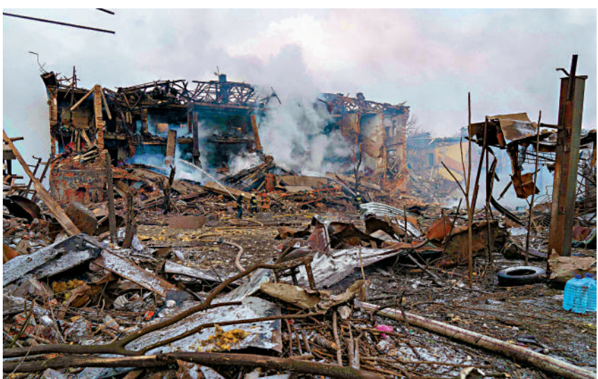
◀ 第聶伯羅一家鞋廠11日被炸毀。

【大公報訊】綜合《紐約時報》、《時代》、《華盛頓郵報》、BBC報道：2月24日，俄羅斯對烏克蘭展開特別軍事行動，烏克蘭總統澤連斯基隨後多次喊話，號召國民團結，譴責俄軍「入侵」，指責西方國家「袖手旁觀」。一夜之間，澤連斯基一躍成為西方媒體筆下「令人信服的戰爭領袖」。更諷刺的是，《紐約時報》2月21日才刊文稱：「澤連斯基，這名演藝人士和表演者，已經被現實揭開了的面具，暴露出他只是令人沮喪的平庸之輩。」僅僅3天後，西方媒體就改變調門，其變臉速度之快令人咋舌。