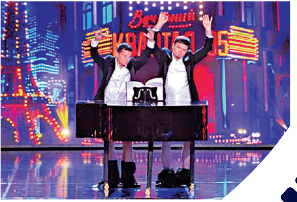
◀ 澤連斯基（左）2016年在綜藝節目上表演。

從宣布參選總統開始，澤連斯基不走傳統的競選拉票路線，Instagram和YouTube成為最常用的宣傳渠道。在與前任總統波羅申科進行電視辯論前夕，澤連斯基要求兩人都提交藥物和酒精測試結果。在全國觀眾的注視下，兩人分別交出自己的血液、尿液和毛髮樣本進行檢測。就連大選當日，澤連斯基也「戲癮十足」，公開展示其選票，涉嫌違法而被警方罰款。