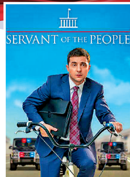
◀ 《人民公僕》劇集宣傳海報。