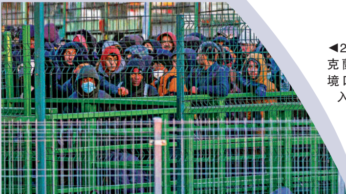
◀ 2月28日，烏克蘭難民在邊境口岸排隊進入波蘭。