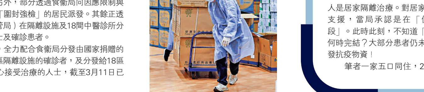
▲中央援港物資由中成藥、口罩、防護衣等皆有，覆蓋全面。

▲面對疫情嚴峻，中央近一個月緊急運送包括中成藥、防疫藥品、醫療用品等防疫物資支援香港，盡顯關愛。