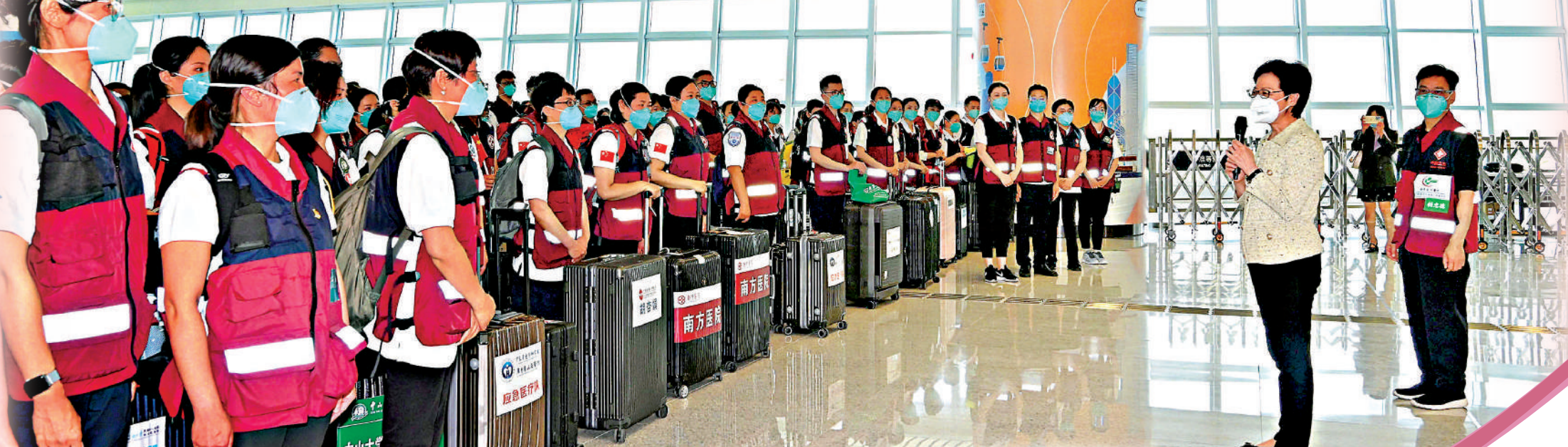
▲300人組成的內地援港醫療隊抵達香港，行政長官林鄭月娥到場迎接。