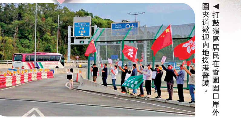
▲打破橫區居民在香港圍口岸外圍夾道歡迎內地援港醫療隊。