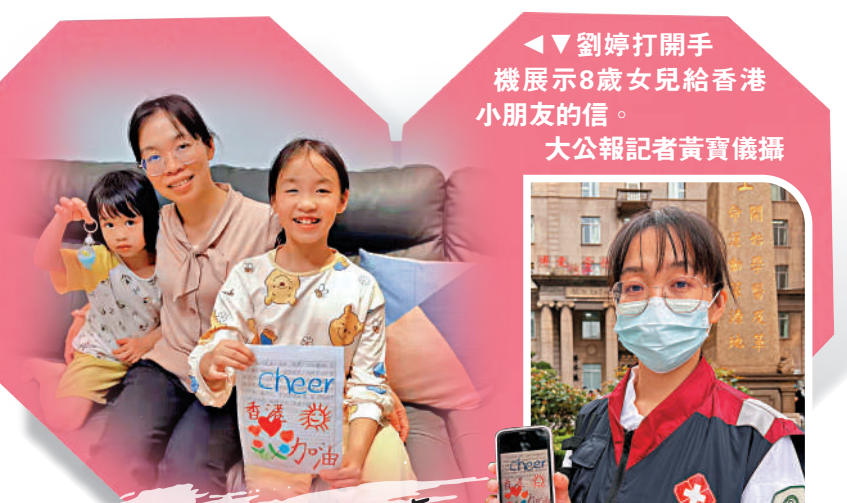
「我把最愛的媽媽送去幫助你們」

應香港特區政府請求，由內地支援香港抗擊工作專班派出的援港醫療隊共200名隊員，昨日下午經香園圍口岸抵達香港。這是三日內抵港的第二支內地援港醫療隊。他們都是各醫院臨床一線骨幹，將在香港亞歷山大區治療設施，全力配合特區政府開展患者的醫療護理工作，幫助香港盡快恢復疫情。行政長官林鄭月娥、香港中聯辦副主任尹宗華等到口岸迎接。林鄭月娥在歡迎儀式上表示，香港疫情仍然非常嚴峻，當務之急是減少死亡、減少重症、減少感染。香港公立醫院的醫護人員嚴重不足，特別是在重症患者救治方面急需支援。大公報記者李薇