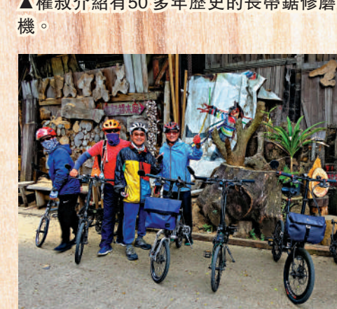
▲木廠獨特的環境成為網紅打卡熱點，有單車友更連群結隊來參觀。