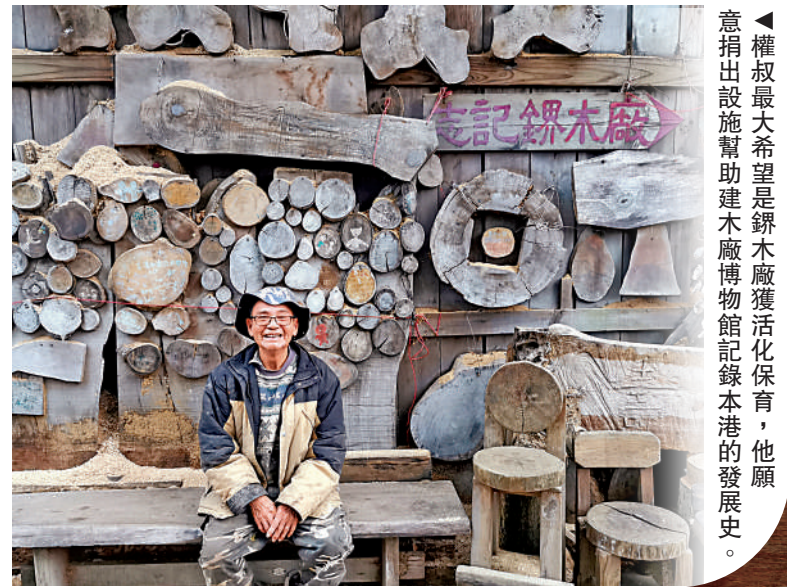
權叔最大希望是鏢木廠獲活化保育，他願意捐出設施幫助建木廠博物館記錄木港的發展史。

珍貴回憶 「懷緬過去，常陶醉，一半樂事，一半令人流淚。」走過大半世紀，由北角搬到柴灣，再輾轉搬到新界古洞，歷經四次大搬遷的「志記鏢木廠」隨着香港的不斷發展，越搬越遠，木材加工業亦盛極而衰，歷盡滄桑。 如今志記已是全港碩果僅存的鏢木廠，獨特的廠景和歷史，令它成為近年影視界的當紅取景地及網紅打卡景點。不過隨着「北部都會區」的加速發展，志記將迎來再一次遷拆的命運。身為木廠第二代傳人的王氏兄弟，一輩子都為木廠打拚，隨着時代在變，他們也在求變，希望把木廠活化保育，不想讓它只存活於記憶之中。 大公報記者 盛德文、黃山（文、圖）