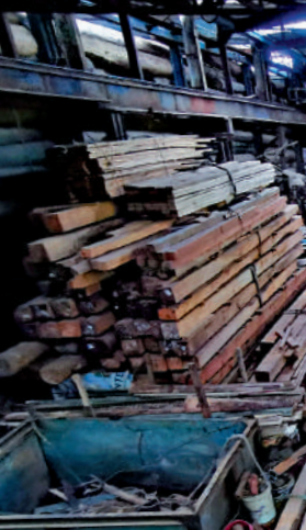
▲權叔指鏢木廠內有很多木材難以搬走，希望政府在附近協助重建。