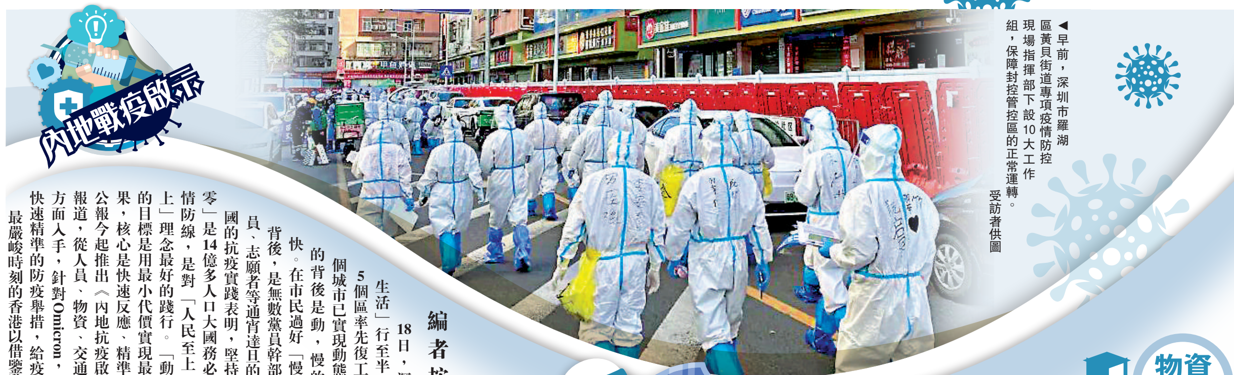
▲早前，深圳市羅湖區黃貝街道專項疫情防組，保障封控管轄區的正常運轉。