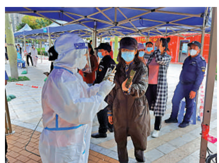
▲深圳志願者在維持核酸採樣秩序。

每天早8點到中午12點，在深圳福田區梅林街道綠景虹灣小區劃定的防疫封控區和管轄區，被稱為整編「實戰訓練營27班」的工作人員身著防護服挨家挨戶爬樓敲門核對信息，採樣做核酸，幾小時下來，每個人都