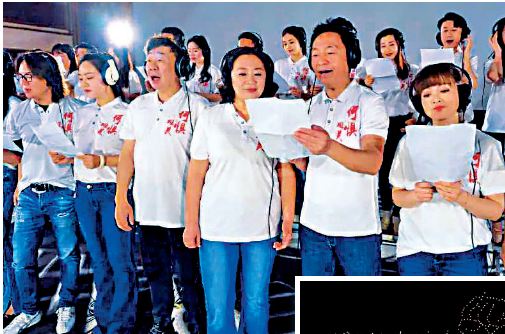
▲35位粵港兩地音樂家齊心合唱援港抗疫歌曲《何懼難關》，憑歌寄意為香港加油。

當晚的無人機表演以夜空為幕布，無人機不斷變換隊形，用一句句鼓舞人心的話語，展現出全國團結一心抗擊疫情的氣魄與精神。同片藍天之下，包括在粵港人在內的來自大灣區各地的民衆都一直牽掛香港的疫情，他們也選擇以各種方式為香港加油，希望香港盡快戰勝疫情。