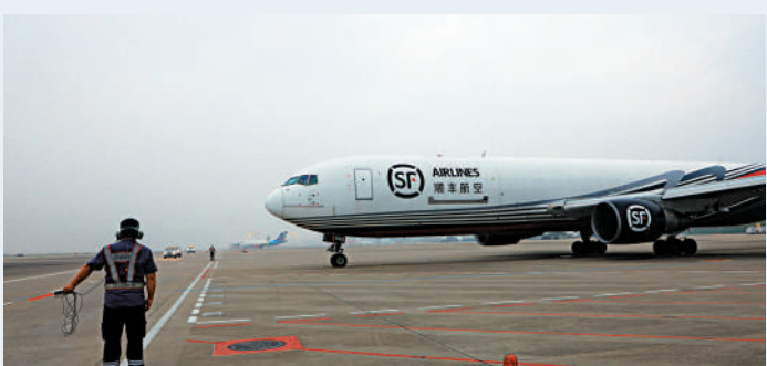
▲3月19日，一架順豐貨運包機從深圳飛往香港，深港兩地貨運包機航線正式開通。 新華社

香港第五波疫情嚴峻，但港人並非孤身作戰。大灣區同聲同氣，一句「我哋撐你」足以表明心跡。為了給香港打氣，一場特別的無人機飛行表演近日在廣州海心沙舉行。當晚，600架無人機相繼起飛，搭配LED燈光，在珠江畔上的夜空匯聚出「萬眾一心同心抗疫」，「香港加油我哋撐你」的鼓勵字句，為香港打氣。無人機燈光猶如點點星光，在空中分散又聚攏，傳達內地民衆的關切和祝福，真情流露，溫馨感人。