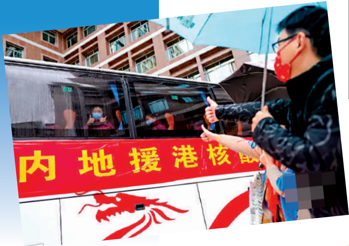
▲援港抗疫的廣東醫務工作者與家人告別。 網絡圖片