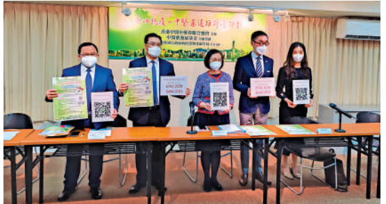
▲「中醫藥遙距診療計劃」今日開始接受患者登記。

今次計劃得到食物及衛生局中醫藥發展基金全額資助，食衛局局長陳肇始說，特區政府會盡全力抗擊疫情，繼續用好中央支持，奮力遏制疫情，致力保障市民的生命和健康。她表示，特區政府會繼續與中醫藥界攜手合作，進一步發揮中醫藥在疫情防治全過程的優勢和作用，有信心在中央支持下、在中醫藥業界團結一致下、在市民配合下，香港能早日戰勝疫情。