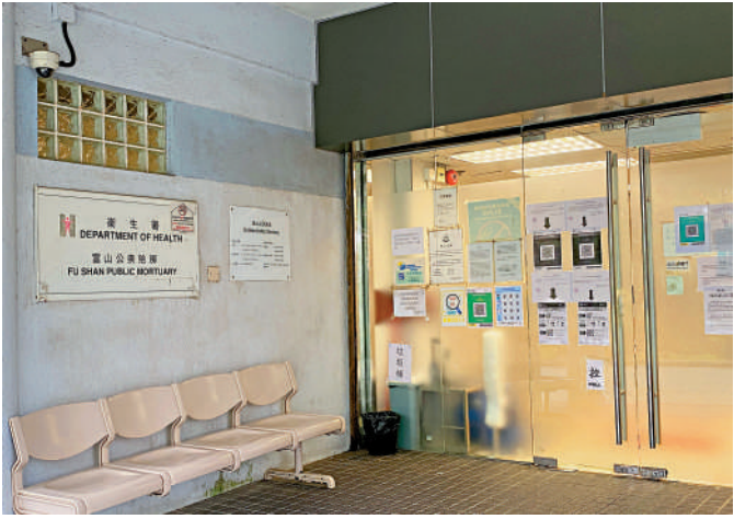
▲▼昨日有市民在警員安排下到富山公眾殮房認領親人遺體，過程大概花30分鐘。