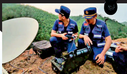
▲救援人員操作無人機搜索現場。