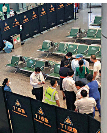
▲家屬在接待區焦急等待消息。