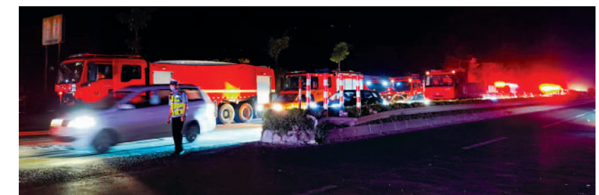
由於道路封鎖，車輛排起長龍。

●埃塞俄比亞航空一架波音737 MAX 8自阿的斯阿貝巴起飛6分鐘後，因機動特性增強系統設計缺陷等原因墜毀，機上157人全部遇難。