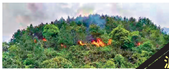
▲東航客機墜毀後，現場一度起火。