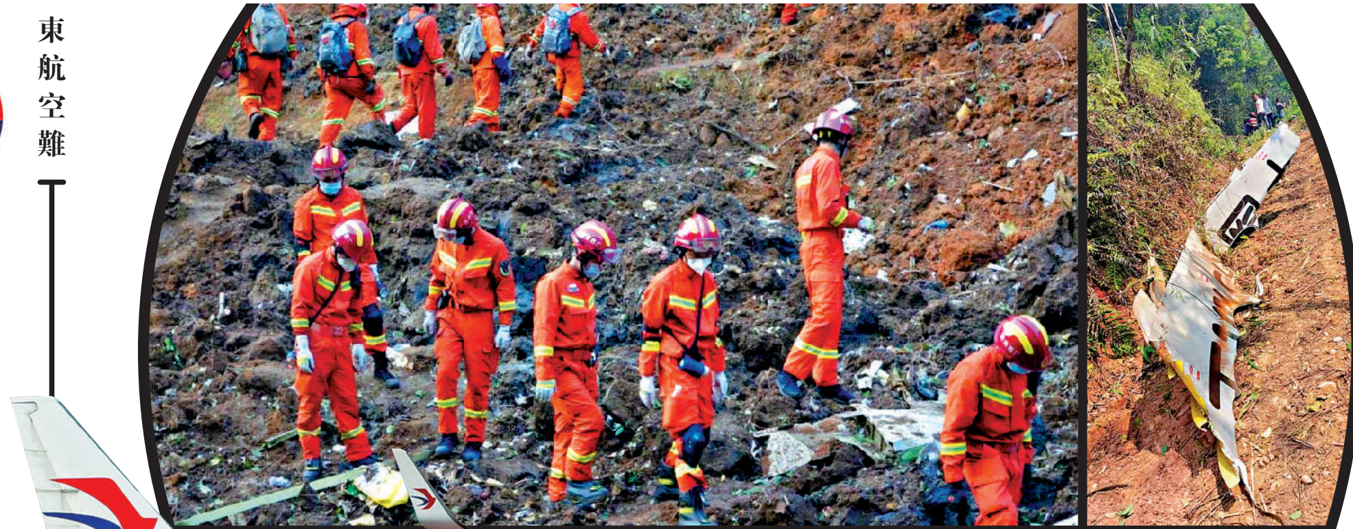
▲消防救援人員在搜索飛機失事現場。

21日14時38分許，東航一架搭載132人的波音737客機在廣西梧州藤縣上空失聯並墜毀。機上人員共132人，其中旅客123人、機組9人。事故發生後，中共中央總書記、國家主席、中央軍委主席習近平立即作出重要指示，要求立即啟動應急機制，全力組織搜救，妥善處置善後。目前，事故現場已展開緊急救援，最先抵達的救援部隊發現客機殘骸和碎片，具體傷亡情況尚未明確。目前，東航官網頁面已轉為黑白色，而截至晚上十點，現場沒有具生命跡象的傷員抬出。 綜合新華社 記者曾萍、蘇徵兵廣西報道