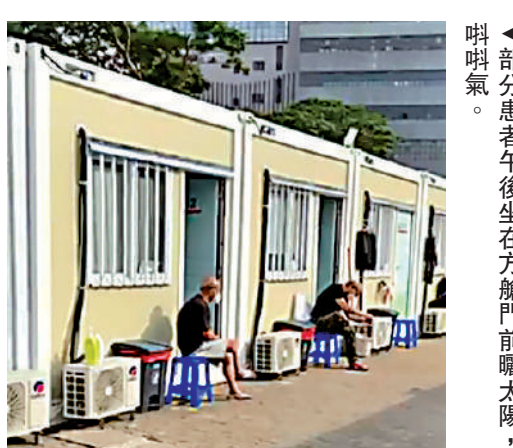
▲部分患者午後坐在方艙門前曬太陽，叫喇氣。