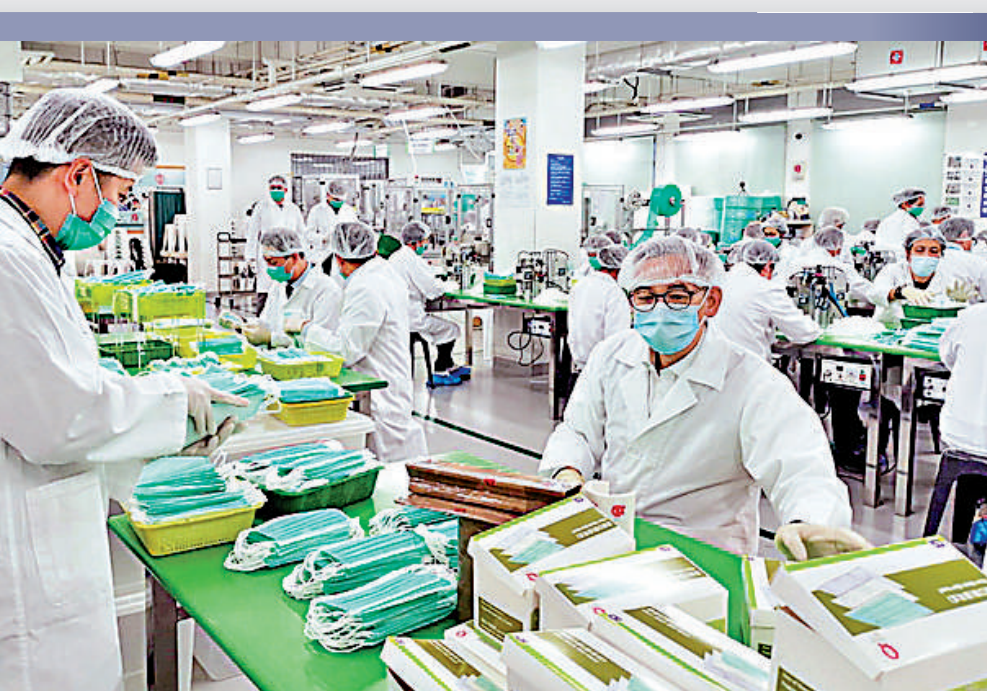
▲爆發之初，胡英明走進羅湖工場，與義工隊製作口罩，貼地抗疫。

胡英明昨日開始退休前休假，他向7000名懲教人員發別信，信中提到，「回想過去33年的懲教生涯，有喜有悲，令我回味莫過於就任署長期間所發生的一切，三年時光雖然短暫，其中經歷卻值得自己一生珍藏，總結自己最大的收穫，是能夠與一班可敬的同事一同作戰，是你們的默默付出給我源源不絕的動力去探索新路。」