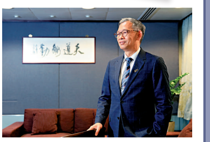
▲胡英明出任懲教「一哥」三年，經歷重重挑戰。

兩年前爆發之初，本港出現口罩荒，懲教署羅湖口罩工場忽然要大幅提升生產力，胡英明穿上保護袍、走進工場與懲教義工隊製作口罩，心繫社群。近期第五波疫情嚴峻，最嚴重時每日有約150名在囚人士確診，亦