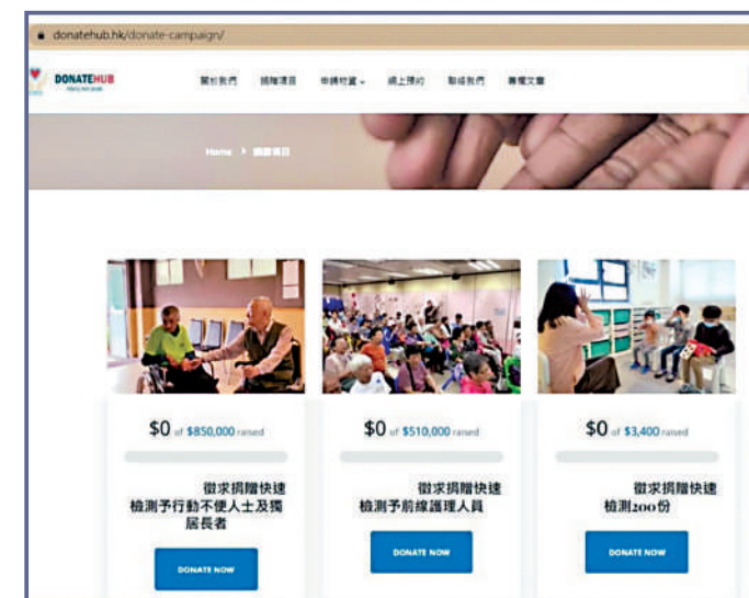
▲涉案網站張貼多個籌款帖文。

同一平台亦自稱為另一社福機構自閉家庭支援及訓練中心「LEX Center」，徵求捐贈快速檢測200份，目標籌款額為3400元。「LEX Center」在官網強調，他們沒有授權任何網站眾籌。