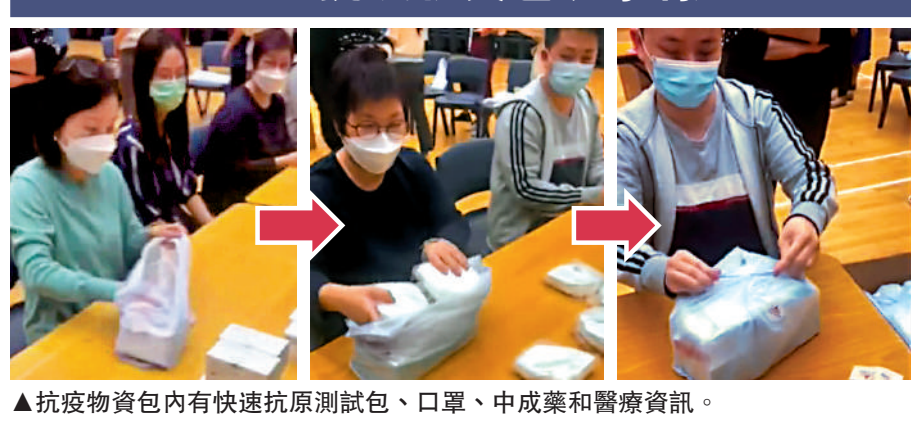
▲抗疫物資包內有快速抗原測試包、口罩、中成藥和醫療資訊。