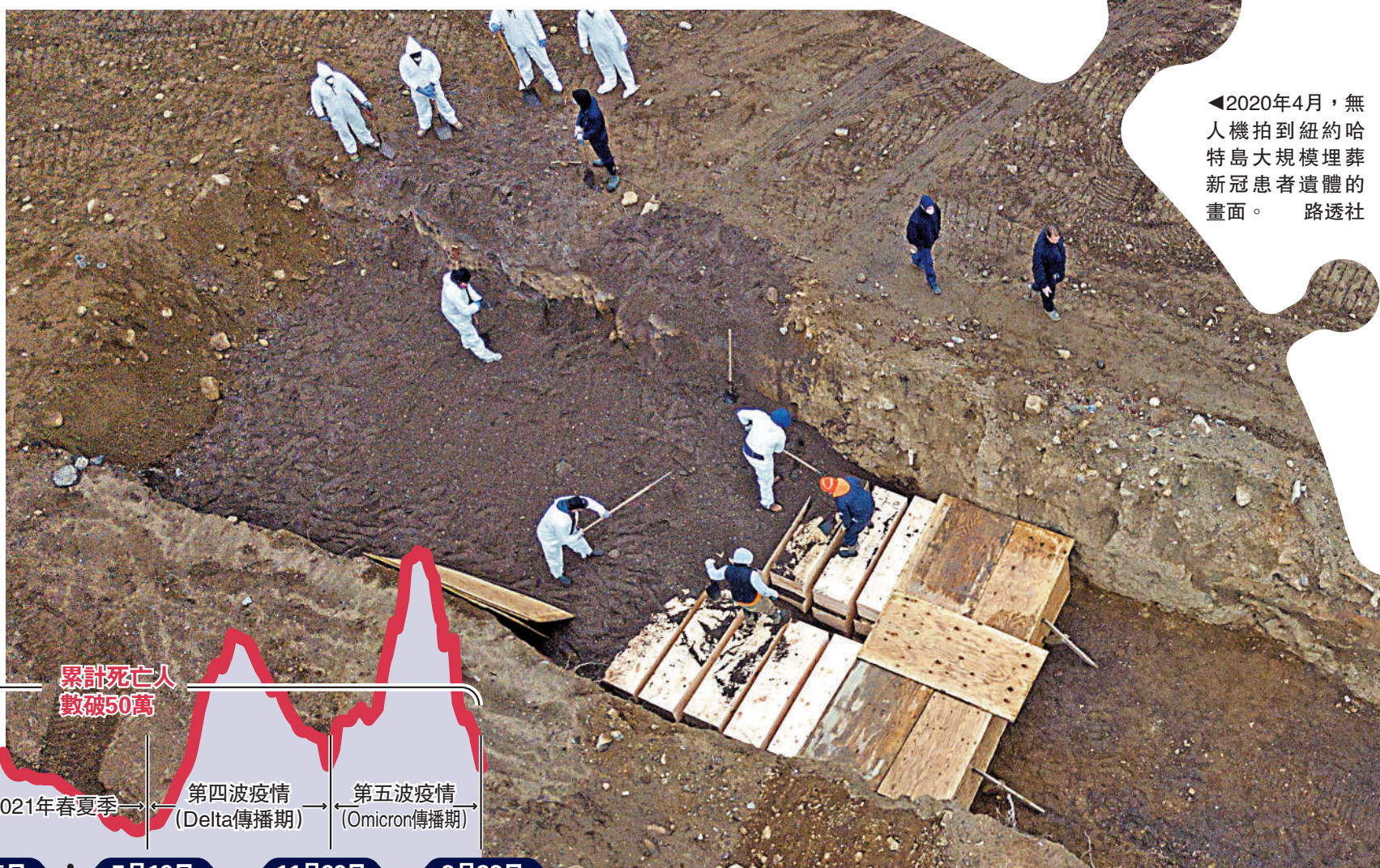
◀2020年4月，無人機拍到紐約哈特島大規模埋葬新冠患者遺體的畫面。路透社

【大公報訊】綜合美國之音、路透社、美聯社報導：根據美國疾病控制與預防中心（CDC）數據，美國23日新增3773宗新冠確診個案，多1288人染疫身亡，累計新冠死亡病例達到972550宗。另一統計網站Worldometers的數據顯示，截至23日，美國的染疫死亡人數突破100萬。在全部死亡個案中，75%死者為65歲以上長者，其中佔比最高的85歲以上年齡組別共錄得209875死亡病例。