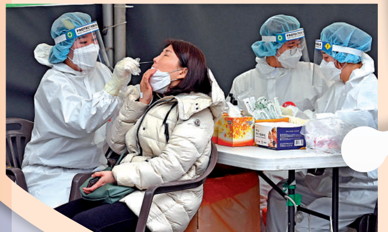
▲首爾醫務人員17日採集受檢者的鼻拭子樣本。

悉尼莫里亞學院在24日向家長發出的電子郵件中表示：「一些班級的學生出勤率已經下降到60%以下，而且還有大量教學人員缺勤。」面對嚴峻疫情，當地部分學校決定恢復早前被政府取消的社交限制措施，例如強制戴口罩和網上授課。