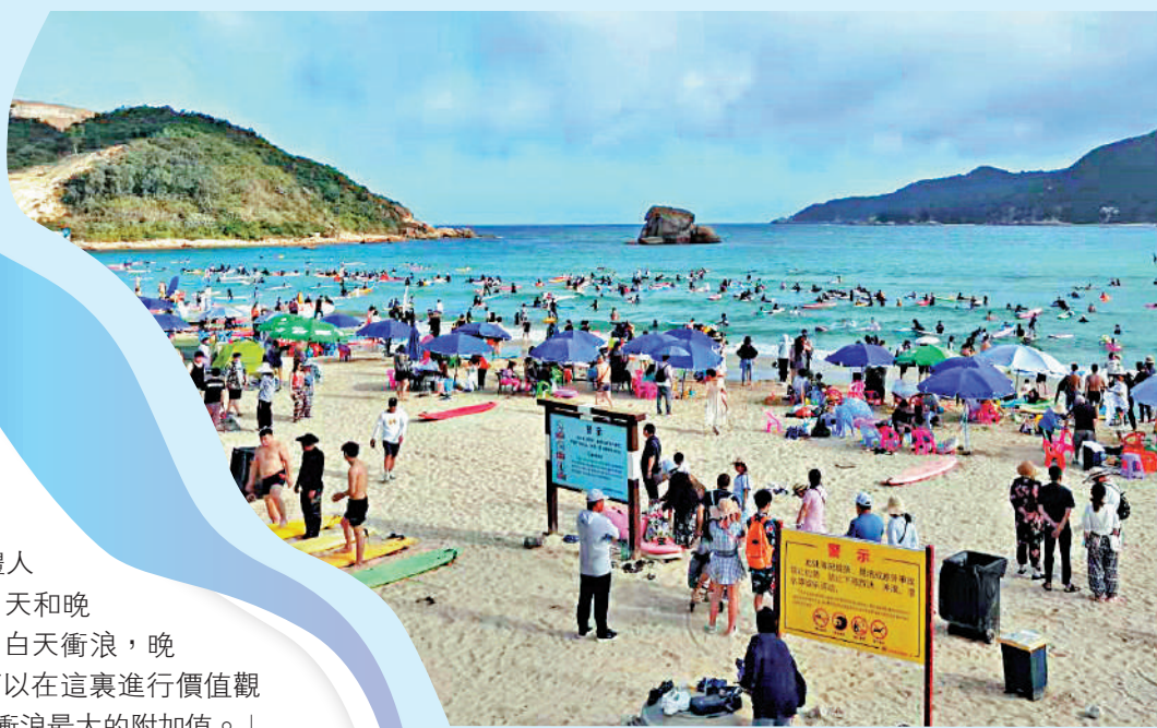
▲後海村是中國衝浪勝地。

大鄭坦言，目前報班學習衝浪的人很多抱着嘗鮮心態，並沒有真正養成衝浪習慣的打算。他們更想得到抱着衝浪板合影的照片，以此來證明自己是潮流中人。不過，他也表示，任何運動都需要吸引人參與為重要前提，筆者請他講一個印象深刻的衝浪學員，「那是一個超過60歲的老奶奶，儘管沒有核心力量站不起來，但她仍抱着衝浪板一次又一次衝向岸邊。後來她告訴我說，被浪托着的那一刻，她感到前所未有的快樂和幸福。」