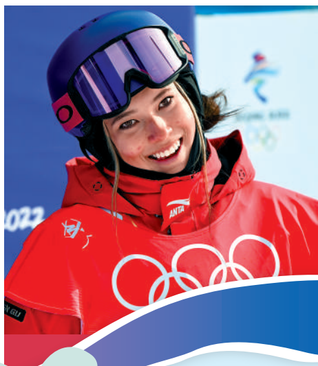
▲北京冬奧冠軍谷愛凌在早前表示，想嘗試衝浪。資料圖片