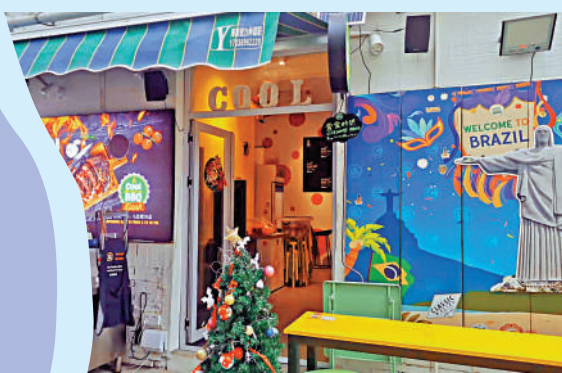
▲後海村充滿年輕文化。