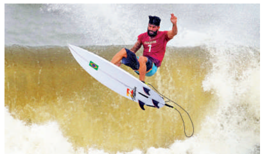
▲衝浪是東京奧運比賽項目之一。資料圖片

後海村見證了中國衝浪市場的野蠻生長，處處都是衝浪店，人人皆可當「教練」，許多自己不會衝浪的人也下海，被行內人戲謔稱之為「專業推板師」。看到衝浪帶來的商機，有漁民，支起一個簡易的棚子，立上幾塊衝浪板，便開始進行衝浪教學。價格戰也隨之打響，目前一節時長兩小時的衝浪體驗課，在平日最低只需要大約200元。