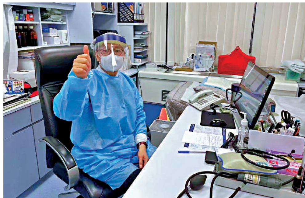
▲iMeddy平台入駐的醫生為此次「免費視像問診服務」點讚。