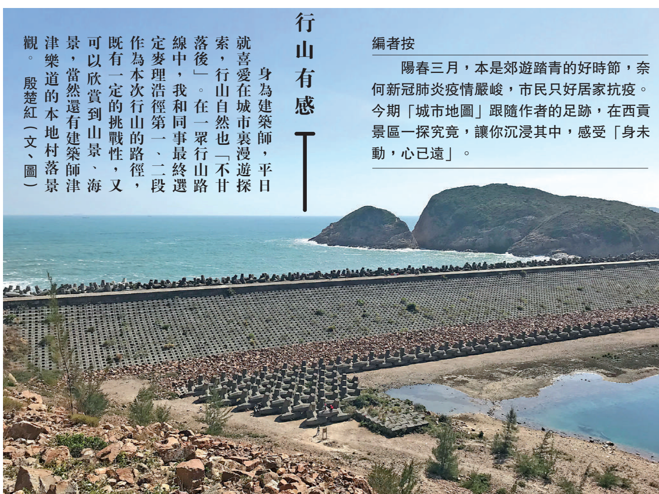
▲萬宜水庫東壩。壩上密布的孔洞用來減緩水流速度，減少對堤壩的損害。

陽春三月，本是郊遊踏青的好時節，奈何新冠肺炎疫情嚴峻，市民只好居家抗疫。今期「城市地圖」跟隨作者的足跡，在西貢景區一探究竟，讓你沉浸其中，感受「身未動，心已遠」。