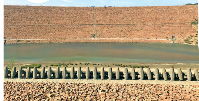
▶站在副壩弱波堤仰視主壩，一道水平線將視野分成清晰的兩部分，往來車輛成了水平線上緩緩移動的小黑點。