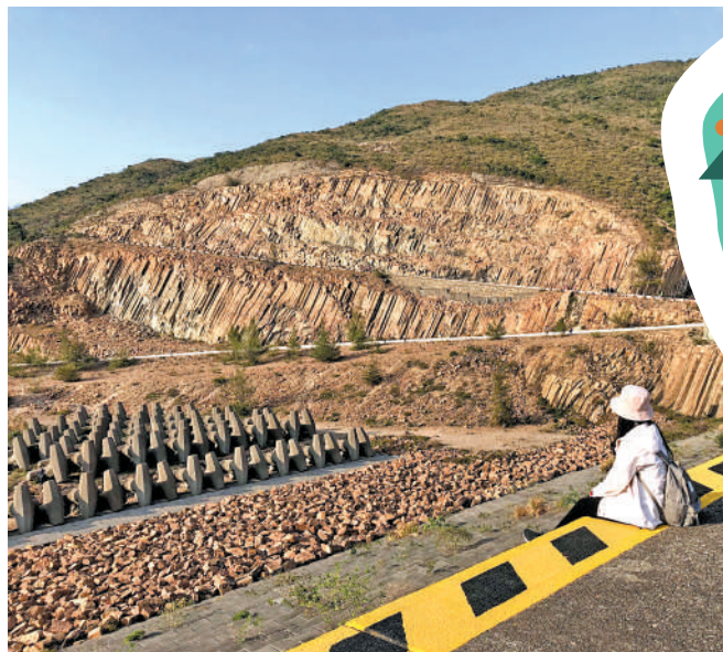
▲西貢萬宜水庫東壩、浪茄及西灣一帶，布滿六角柱石群。