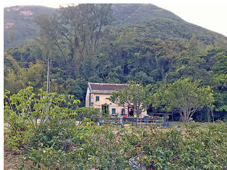
▲散落在山水自然中的鄉土民居，寧靜且樸素。

耗，雙腿彷彿成了機械控制前後交替移動的假肢，終於，約1小時之後我們到達西灣村，看到士多招牌，大家紛紛歡呼起來，一下子來了精神。當冰豆花端上枱，顧不上加糖漿和糖粉，我舀起一勺豆花，迫不及待地送入口中，整個人的精神都為之一振。海灘上除了我們這樣的行山客，西灣也是露營愛好者的天堂，無論是海邊還是村子裏的露營地上都填滿了各式各樣的彩色帳篷，夕陽時分，大家都忙着搭帳篷，準備各種餐食，各個帳篷之間的距離很小，但人們忙忙碌碌穿梭的身影卻也熱鬧有趣。遠眺西灣村，翠綠的山巒上也開始飄起裊裊炊煙，鼻子裏聞到的是久違的柴火燃燒的味道，微微刺鼻卻也讓人感到溫暖和安心。穿過西灣村，目光所及都是一些兩坡頂的「土味」民居或是鐵皮木板搭建的棚屋，相比於中環高樓林立的現代與摩登，它們更是千千萬萬普通人的根。路過其中一個小院子，遠遠就聽到那裏傳來悠揚的民謠，走近看到一個大爺悠閒地躺在搖椅上，手裏握着一杯紅酒，那怡然自得的神情讓我心馳神往。