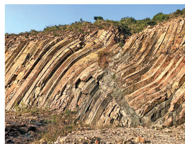
▲萬宜水庫附近的S形火山岩柱。

世界各地的岩柱大多由含矽質較低的深灰色玄武岩構成，惟香港的岩柱是富含矽質的淺色流紋質火山岩，柱狀節理主要呈五邊或六邊形。根據估計，火山岩柱的面積逾100平方公里（含海域），露出地面的高度達100米，總厚度超過400米，平均直徑1.2米。火山岩柱擁有凝灰岩和熔岩的特徵，關於它們的成因，地質學者持有不同的看法和解釋，其成因和成分仍是一個謎團。