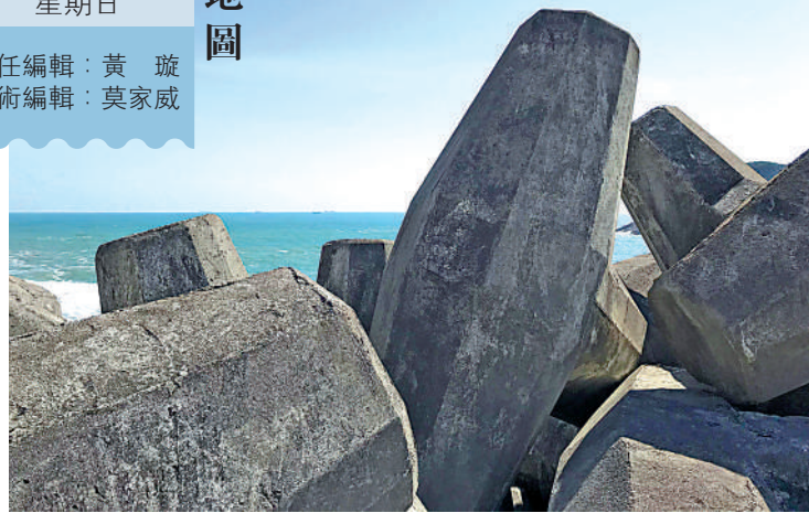
▲巨大錨形弱波石單個尺寸都接近4至5米長，3米高。

說到麥理浩徑 (MacLehose Trail)，它是香港最早啟用的一條長途遠足徑，於1979年10月26日啟用，以時任香港總督麥理浩命名、並且由其本人主持剪綵開幕。麥理浩徑全長100公里，共分10段。比較主流的路線之一是從西貢市中心出發至西灣亭作為行山起點，一路行經鹹田灣、赤徑，最終在北潭凹結束行程，由於略過西灣山，所以相對輕鬆。但為了不錯過萬宜水庫東壩這一壯觀的人工和自然共同創造的景觀，以及被譽為香港最美沙灘之一的浪茄灣沙灘，我們最終路線是搭的士直達萬宜水庫東壩，遊玩參觀後行至浪茄灣沙灘，這一段較為輕鬆的路程作為「征服」西灣山的熱身，再翻越西灣山到達西灣村和西灣沙灘，啃完這塊「硬骨頭」，再以一段不到1小時的路程到達終點西灣亭。