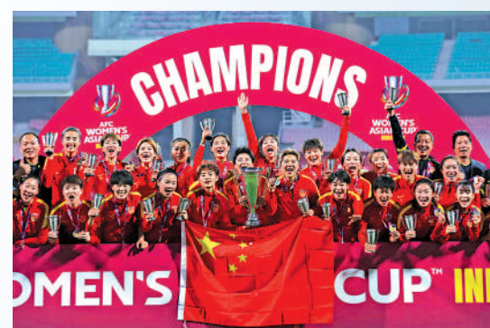
▲中國女足在今年2月重奪亞洲盃冠軍。