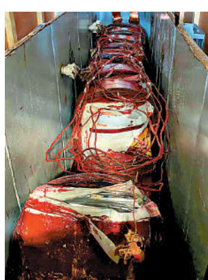
▲販毒集團將市值逾一億元的懷疑可卡因收藏在大型電力變壓器內運到香港。

其後有兩名少年到場簽收貨物，關員當場將兩人拘捕。翌日在葵涌再拘捕一名49歲物流公司女職員。兩名被捕少年已被暫控一項企圖販運危險藥物罪名，將於明日在粉嶺裁判法院提堂。被捕女子則被扣查。