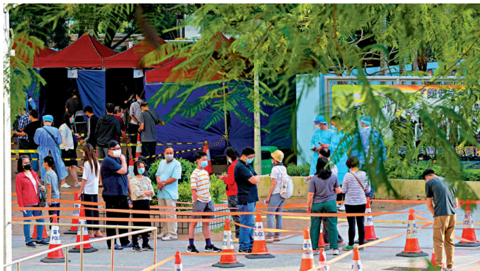
▲近日確診數字雖回落，但死亡數字仍高企，市民仍不可鬆懈。圖為被圍封的大埔廣福邨廣平樓，居民須接受強制檢測。