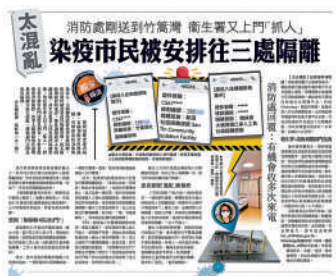
▲《大公報》昨日報道，確診市民入住隔離設施安排被指混亂。

【大公報訊】《大公報》昨報道，有確診市民入住隔離設施後，仍多次收到政府來電安排入住隔離設施，並被衛生署人員責怪無留在家中等候隔離。行政長官林鄭月娥昨在記者會表示，在報章看到有關報道，承認安排有「不足、不善之處」，政府一定引以為鑒，盡最大努力改善。