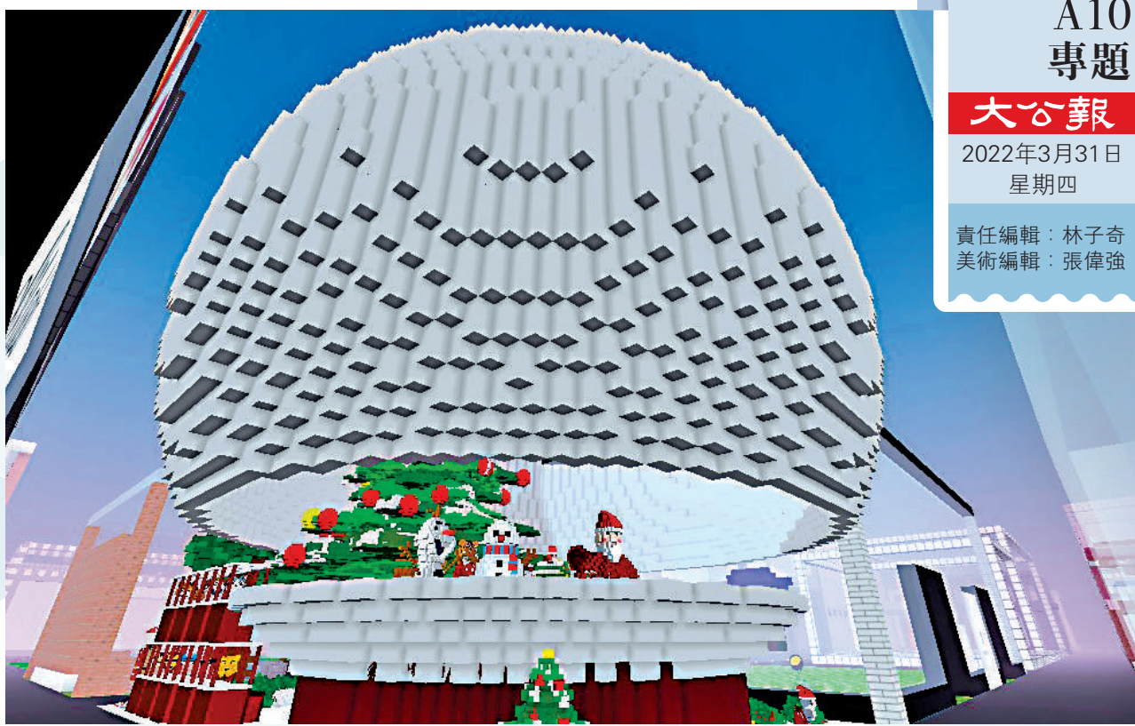
▲烤仔建工在CV建造的聖誕舞會場地，上方是超現實的懸空半球體。

「元宇宙」概念，自「橫空出世」以來，便一直是資本、社交媒體、大眾關注和追捧的熱點。在元宇宙所創造的虛擬空間內，超大规模的創造場景不僅改變了人們的消費行為，產生了新的消費方式，也為人們提供了新的工作機會。無論是為元宇宙人重塑「第二身份」的捏臉師，還是在虛擬世界裏搭建「烏托邦」的虛擬建築師……在元宇宙時代，獨特的新服務和新商業模式將為「創造者經濟」提供新的可能。大公報今起推出《元宇宙新職業》系列，解構虛擬世界的創新行業，帶領讀者體驗在元宇宙打工的滋味。