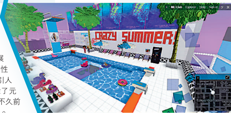
▲烤仔建工在CV建造的天台泳池，用戶可穿過池底中央的洞回到樓下派對空間。

項目：共14個（包括完工和在建） *有交互效果的收費，不帶交互效果會低一點。 （資料截至2020年12月末，貨幣單位為人民幣）