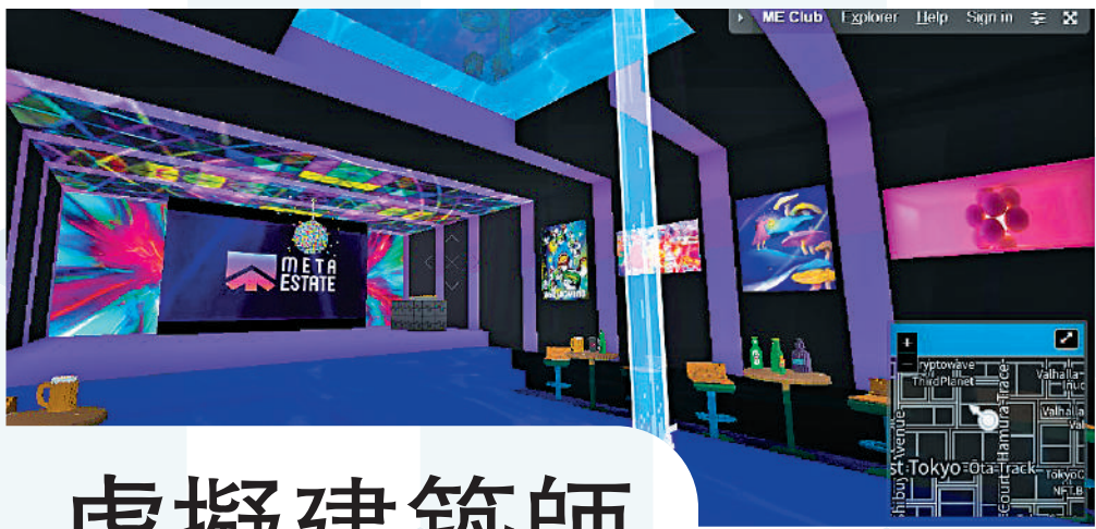
▲烤仔建工團隊在CV搭建的派對空間，吧、屏幕一應俱全。