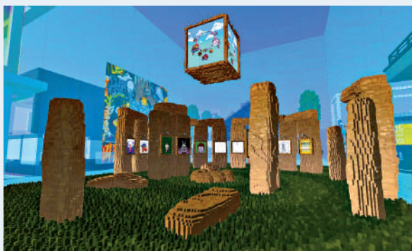
名稱：@westcoastbill 21x : stone age 簡介：CV著名建築師westcoastbill三大作品之一，以巨石陣為題材，位置就在用戶出點旁