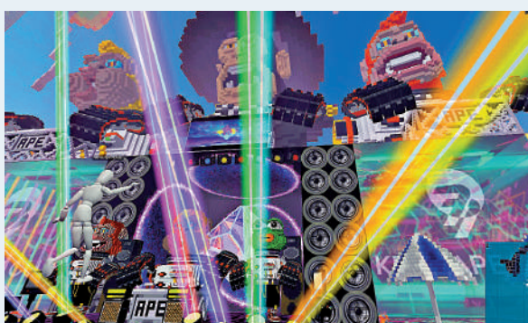
名稱：LUENAH LAND 簡介：由luenah.eth擁有，在2021至2022年的跨年夜與Klay Ape Club共同舉辦了跨年派對