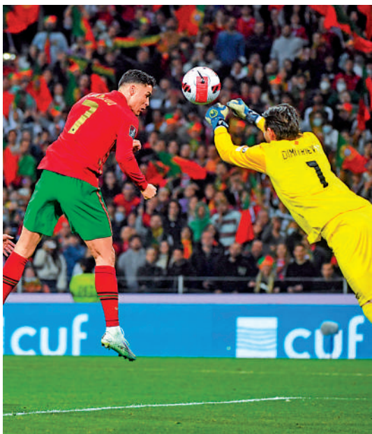
▲C朗拿度（左）老而彌堅。