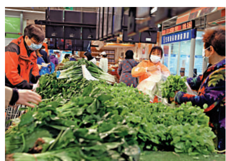
◀3月31日，在上海市普陀區的超市內，市民購買蔬菜。

餐飲經營場所暫停堂食，可提供到店自取、外賣訂餐服務。各區、各有關部門要做好市民生活服務保障。加大生活必需品保障力度，加快調運配送，確保供應充足、價格穩定、配送及時。統籌醫療資源，暢通就醫通道，切實保障市民群眾特別是孕產婦、血透、放化療等特殊患者的應急就醫需求。