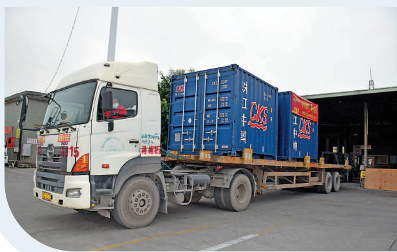
◀東莞對於陸路跨境運輸車輛的進出口收發貨人每車次補貼500元。 大公報記者盧靜怡攝