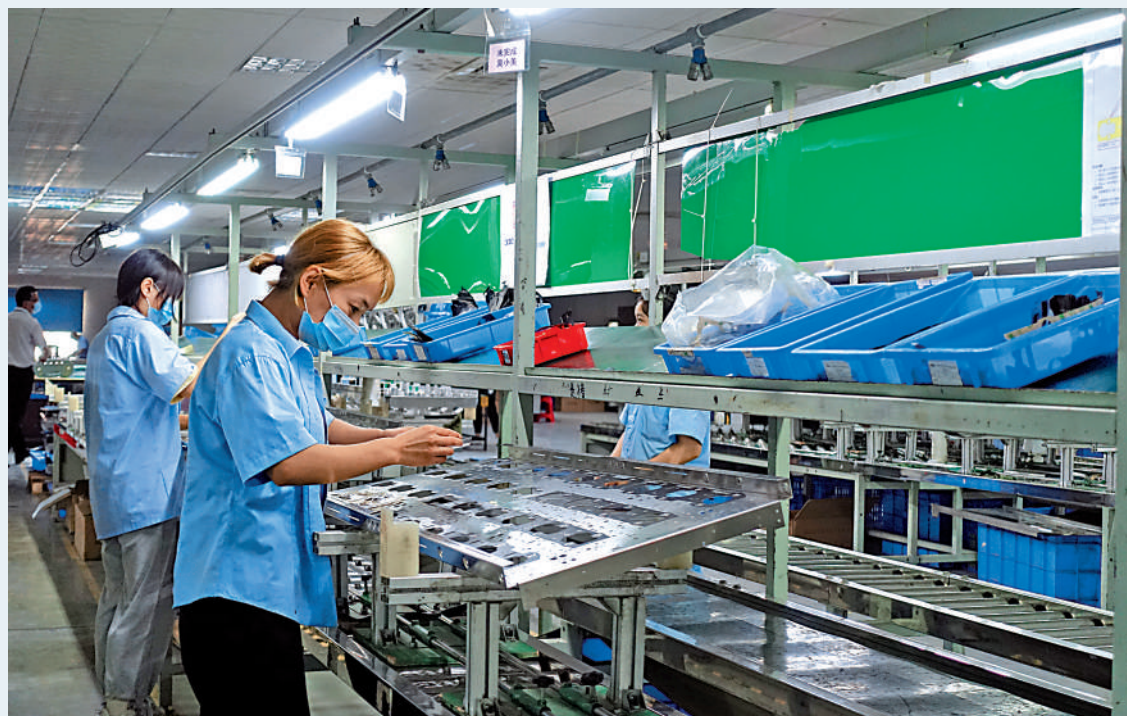
▲本輪東莞疫情基本受控後，企業加快復工復產，追趕訂單進度。圖為東莞一家企業生產車間。