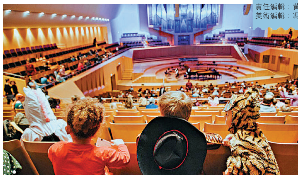
未能如期上演的沉浸式互動歌劇《拉娜》。