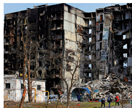
▲馬里烏波爾一棟建築3月30日遭炮擊。

歐洲復興開發銀行預測，俄烏衝突可能將使烏克蘭今年GDP大跌20%，俄GDP下滑10%，引發「自20世紀70年代初以來最大的供應危機」，並將對衝突區域外的經濟同樣產生嚴重影響。