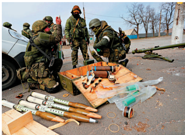
親俄士兵3月31日在馬里烏波爾準備發射反坦克榴彈。

之時出現的。分析指，西方情報機構和媒體一方面認為俄軍正在重新部署軍力、調整進攻策略，一方面又致力宣傳其「不堪一擊」，希望俄烏衝突長期延續下去。