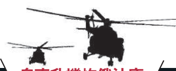
烏直升機炸俄油庫