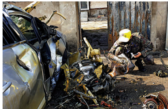
▲韓國軍方人員1日在檢視墜機殘骸碎片。

這是韓國空軍今年第二起飛機墜毀事故。1月11日，韓國空軍一架F-5E戰機在京畿道華城的一座荒山墜毀，一名飛行員殉職。