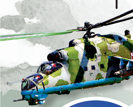
有消息指烏軍1日襲擊「雌鹿」武裝直升機。

【大公報訊】綜合俄新社、路透社、《華爾街日報》報導：俄羅斯別爾哥羅德市的一處石油設施1日遭兩架烏克蘭武裝直升機襲擊，造成8個儲油罐起火，兩名工人受傷。這是俄烏衝突爆發以來，烏軍首次越境襲擊俄設施，克里姆林宮發言人佩斯科夫警告，事件未給雙方和談創造有利條件。烏克蘭外交部對消息不置可否。