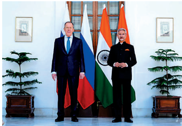
▲俄外長拉夫羅夫（左）和印度外長蘇傑生1日在新德里會晤。

對於拉夫羅夫訪印一事，西方國家反應激烈，認為這將破壞美國及其盟友的對俄制裁。美國商務部長雷蒙多喊話印度盡快「站在歷史正確的一邊」；澳洲貿易部長特漢也呼籲「民主國家」應團結一致。