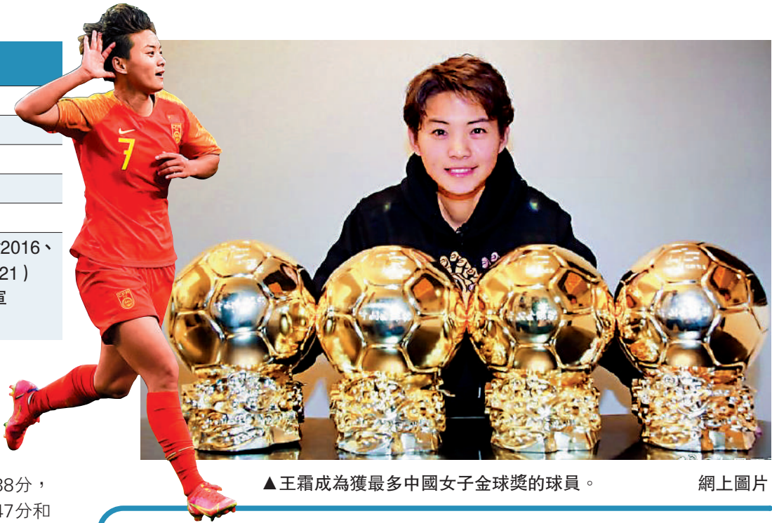
王霜成為獲最多中國女子金球獎的球員。

三位有過旅歐經歷的球員間展開——武磊、郭田雨和張玉寧。經過國內外119名資深媒體人的投票，創造了中國男足單屆世界盃外圍賽進球紀錄的武磊得到了405分，第三次捧得中國金球獎。同在2021賽季打出中超生涯最佳表現的郭田雨和張玉寧，分別以257分和240分位居其後。