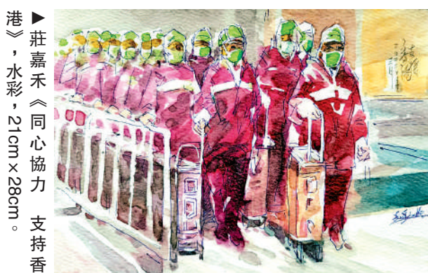
莊嘉禾《同心協力 支持香港》，水彩，21cm x 28cm。