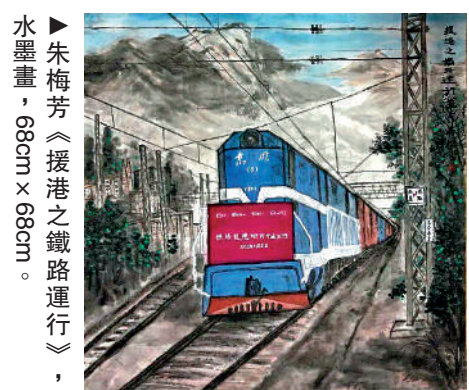
朱梅芳《援港之鐵路運行》，水墨畫，68cm x 68cm。