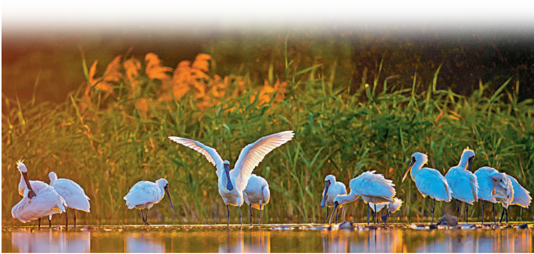
▲全球黑臉琵鷺數量達6162隻，較去年上升18%，創紀錄新高。