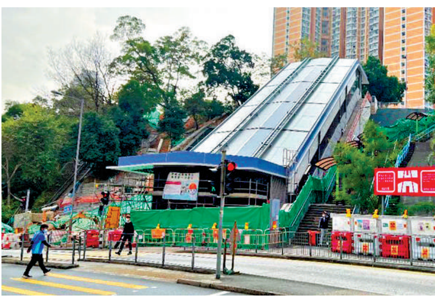
▲全港第一個公共有蓋斜道升降機系統將於4月6日啟用。