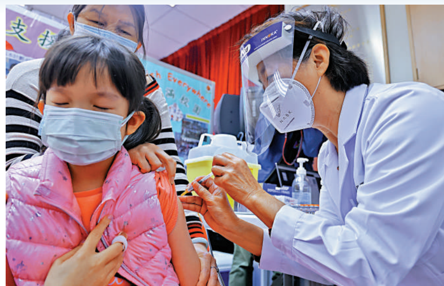
▲調查顯示，六成半家長不贊成小學及幼稚園於4月19日復課。