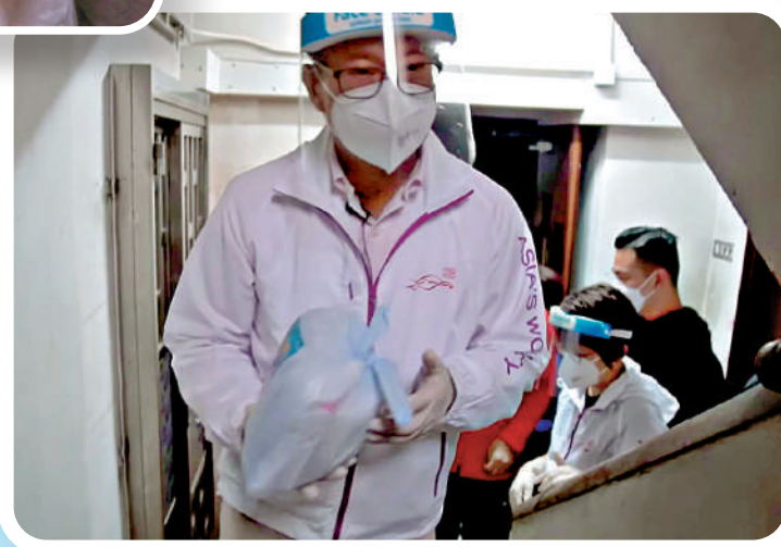
▲財政司司長陳茂波與義工隊一同行樓梯上樓派發。