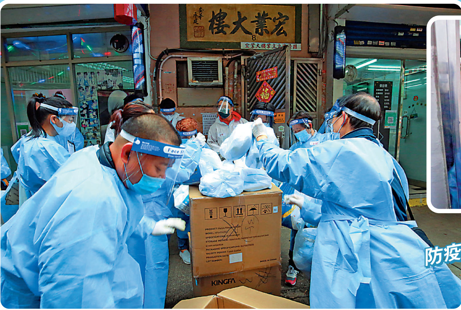
▲義工隊不分男女老幼，都積極參與派發防疫包，為香港防疫抗疫工作出一分力。