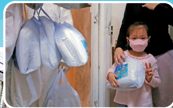
▲有收到防疫服務包的小妹妹舉起V字手勢。