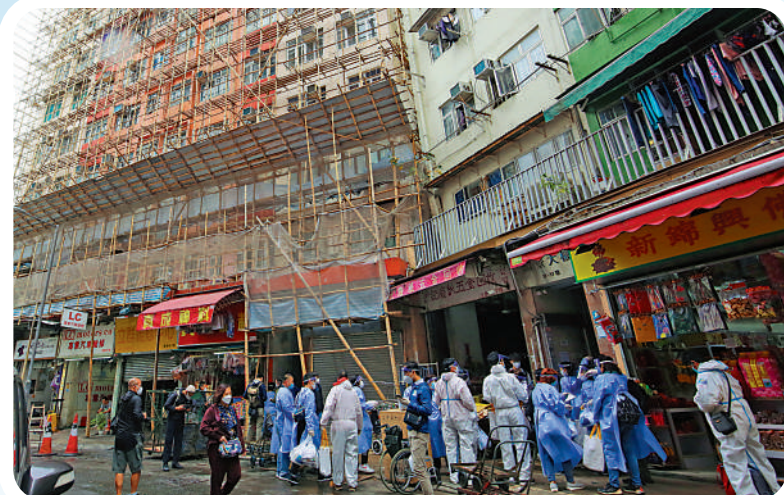
▲政府昨日首天派發防疫服務包，主力目標是三無大廈以及較基層的社區。