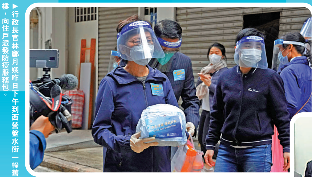
▲行政長官林鄭月娥昨日下午到西營盤水街一幢舊樓，向住戶派發防疫服務包。