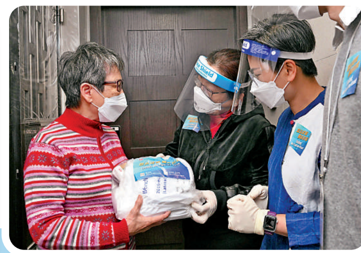
▲律政司司長鄧炳(中)到新蒲崗一帶，向家庭住戶派發防疫服務包。