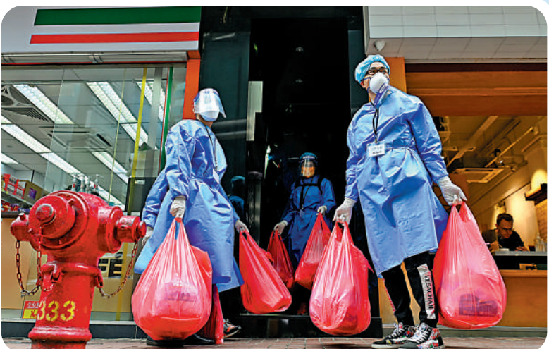
▲身穿防護衣的義工，把一袋袋防疫服務包送到住戶家中。