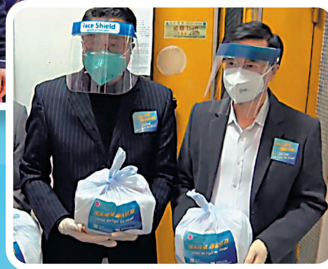
▲政務司司長李家超(右)昨日下午到訪北角春秧街一座「三無大廈」，派發防疫服務包。