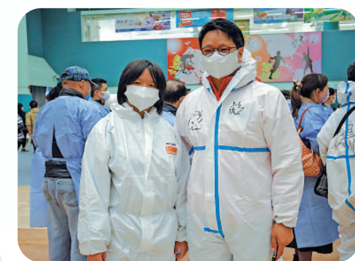
▲昨日天氣雖然較冷，但完全無阻義工們齊心抗疫的熱情。