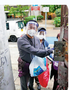
▲立法會議員鄧泳舜表示，希望政府在防疫防疫工作中，用好地區組織的力量。