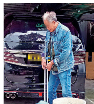
▲村民認為應急醫院可幫助確診者獲得醫治，工程出現噪音也是值得。

位於落馬洲河套區的援建項目，包括提供約1000張負壓床位的應急醫院，以及約10000個床位的社區隔離和治療設施。大公報記者現場所見，多塊工地正在施工，在其中一塊工地上，兩組以「打包箱」（貨櫃）砌成呈魚骨狀的建築物，估計是應急醫院，另外有20多個以「打包箱」砌成