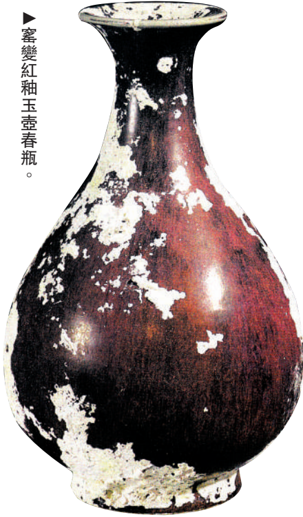
▲窰變紅釉玉壺春瓶。

「泰興號」為一艘中國商船，於道光二年一月由廈門港啟程，赴今印尼的雅加達——爪哇島當時最重要的貿易城市之一進行海外貿易，順季風而南下。通過打撈團隊在水下作業時進行的初步測量，可見該船體量巨大，通長約五十米、寬約十米，桅杆長度超過三十米。發現時，沉船所在海床位置約在水下三十米左右。