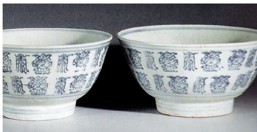
▲青花變形壽字紋碗。

釉上彩瓷數量較少，有盤、碗，為釉上粉彩裝飾變形蓮紋。器物內底處均有一圈刮釉露胎的澀圈，應為以疊燒工藝裝燒時便於疊擦所致。因海水長期浸泡，釉上彩料剝落較為嚴重。