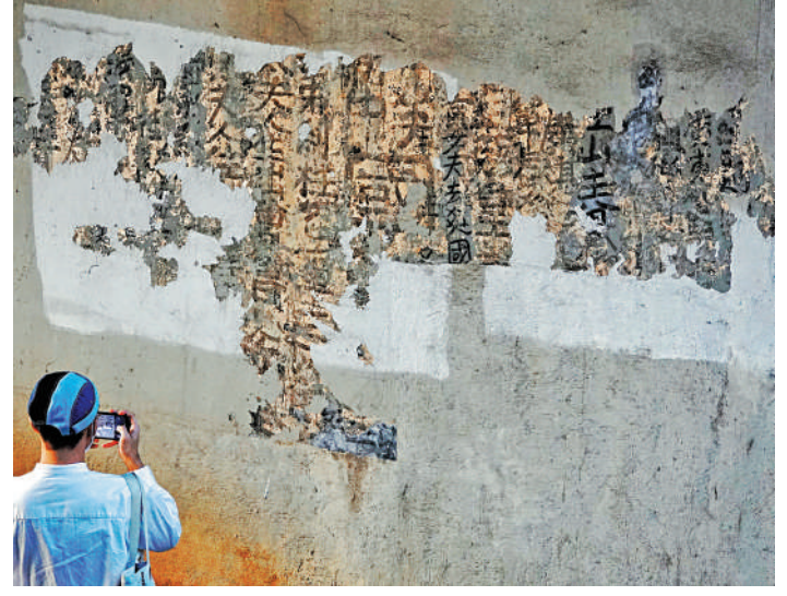
▲位於旺角界限街東鐵線橋墩的「九龍皇帝」真跡，重見天日，市民趁機打卡留念。

勞工及福利局局長羅致光昨日在網誌提到，當局因應第五波疫情，放寬護理業界「補充勞工計劃」三個月，截至本月1日，勞工處已接獲415宗申請，批准了364宗，涉及2054名輸入護理員。 對於近日有評論指缺乏人手的只是私營院舍，羅致光重申，不論私營或資助院舍，人手不足是不爭事實，院舍照顧行業需要4.5萬人，但現時只及約八成，有近兩成、即1.1萬人短缺。羅致光指出，短中期輸入內地甚至外地勞工，是不可或缺的方法，當局短期內會向立法會提出修例，改善院舍多項法定要求，包括人均面積與人手比例等，而面對新增需求，希望近月短期加入護理行業的人日後留在安老業，形容是必須共同思考的問題。