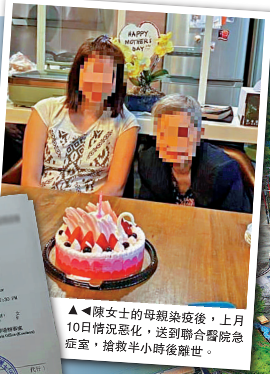
▲陳女士的母親染疫後，上月10日情況惡化，送到聯合醫院急症室，搶救半小時後離世。

避免重演 第五波新冠疫情累 計死亡患者已達7000人，當中不少患者離世後，遺體失蹤，家屬承受喪親之痛，還要奔走尋找親人遺體。陳女士（化名）的媽媽在公立醫院的急症室離世後，陳女士見過遺體最後一眼，直到在公眾殮房再次見到媽媽，已相隔二十日，認領遺體時赫然發現媽媽變得面目全非，嚴重膨脹，五官浮腫，皮膚發黑，只憑一頭白髮的特徵，相信眼前的就是自己的媽媽。 陳女士深受打擊，「到底這三個星期，媽媽都經歷了什麼？去了哪裏？為什麼會變成這樣？」議員希望這一類悲劇勿再發生。 大公報記者 伍軒沛