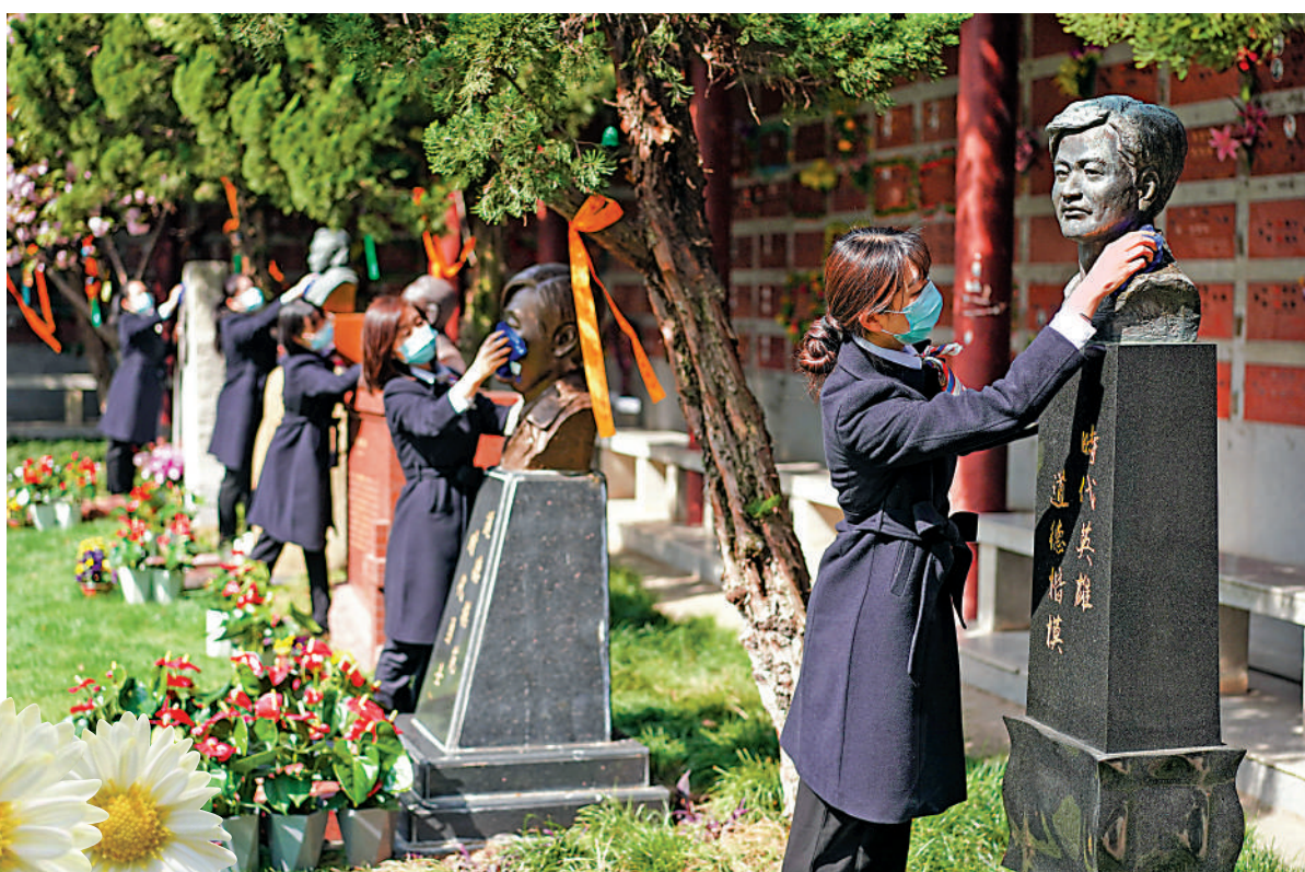
清明期間，內地組織代祭掃等公益活動，滿足居民祭奠追思需求，表達對逝者的哀思。圖為4月4日，在南京市雨花台功德園，工作人員在擦拭烈士墓碑。