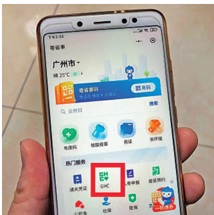
▲粵康碼有「粵省事」粵康碼、GHC兩個版本。

據悉，GHC與「粵省事」粵康碼判定同規則，同樣採用紅碼、黃碼、綠碼三種標識。對於與入境人員同行的未成年人、老年人等不便使用手機的人員，可通過GHC同行人員管理功能。