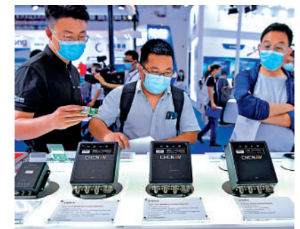
▲觀衆在去年於南昌舉行的第十二屆中國衛星導航成就博覽會上參觀。資料圖片

【大公報訊】記者海巖北京報導：國家發改委近日答記者問時表示，「十四五」期間將推進北斗在能源交通、自然資源、城市建設、生態保護、大眾消費等領域應用，提升北斗服務經濟社會發展的能力。