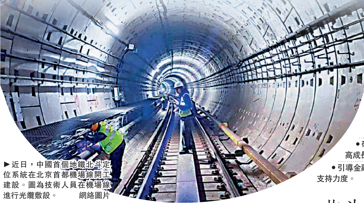
近日，中國首個地鐵北斗定位系統在北京首都機場線開工建設。圖為技術人員在機場線進行光纖敷設。