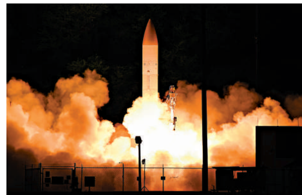
▲2020年3月,美軍高超音速助推滑翔飛行器(C-HGB)在夏威夷太平洋導彈靶場發射。

中國外交部發言人趙立堅6日表示，奉勸美英澳正視亞太國家求和平、謀發展、促合作、圖共贏的願望，摒棄冷戰思維和零和博弈，忠實履行國際義務，多做有利於地區和平穩定的事。中國常駐聯合國代表張軍5日警告稱，不要採取可能在世界其他地區助長類似烏克蘭危機的措施。