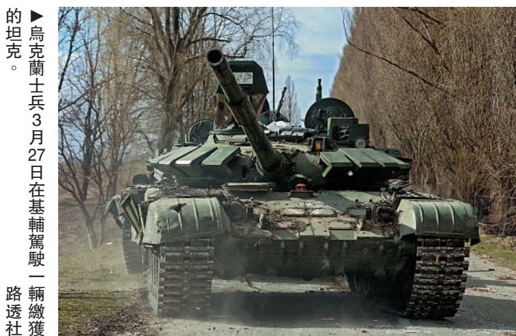
▲烏克蘭士兵3月27日在基輔駕駛一輛繳獲的坦克。