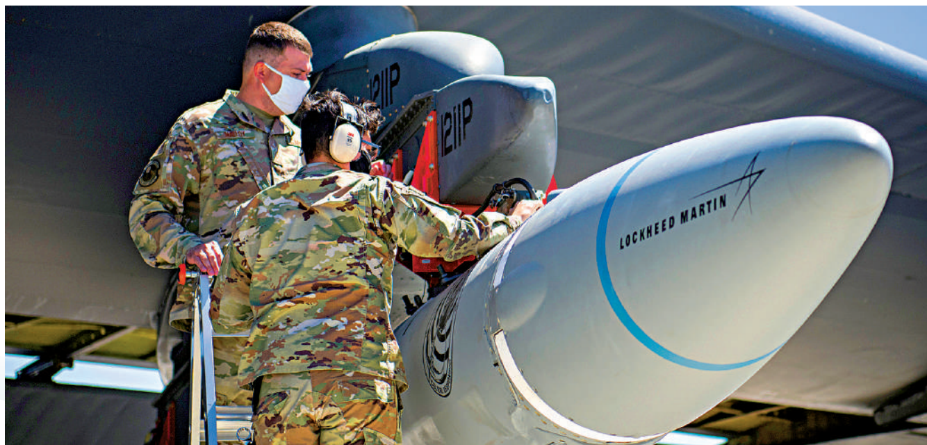
▲2020年8月,美軍在加州空軍基地檢查AGM-183A高超音速武器。