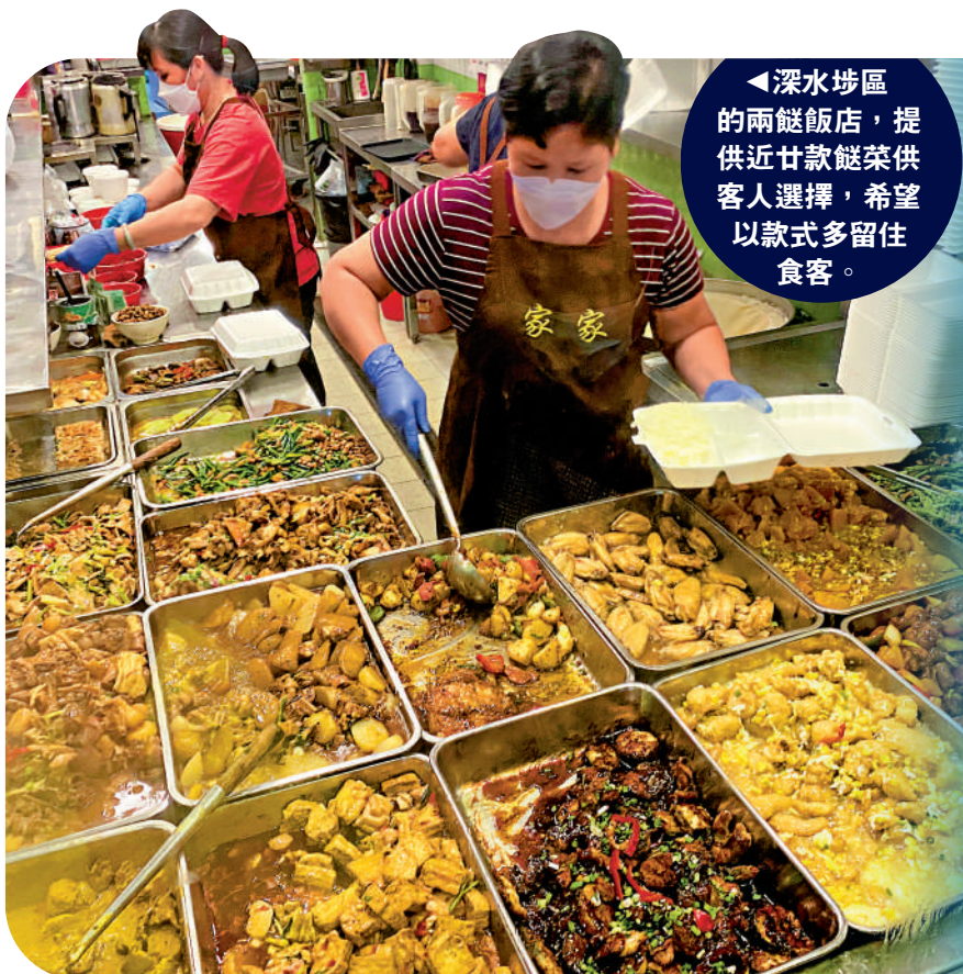
深水埗區兩餸飯店，提供近廿款餸菜供客人選擇，希望以款式多留住食客。