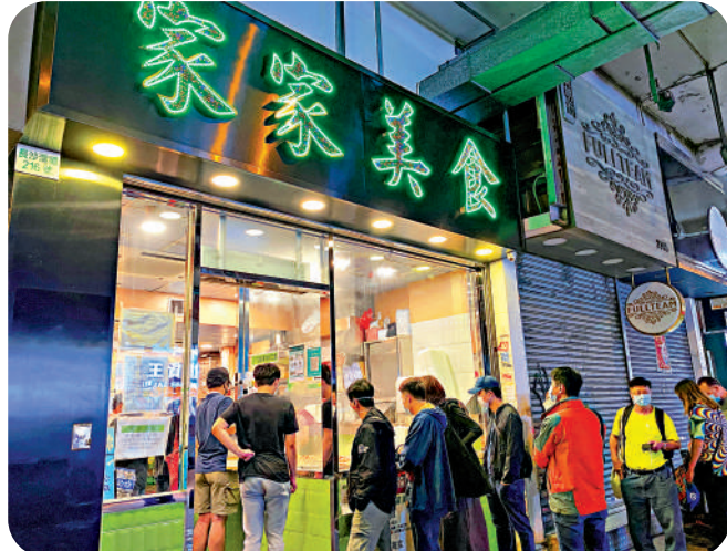
兩餸飯外賣店門外雖然大排長龍，但隨着競爭大，經營較以前困難得多。