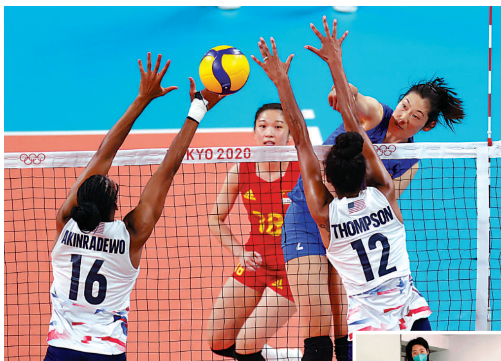
▲朱婷（後排右）在去年東京奧運中，全力出戰。

今年下半年，杭州亞運會和女排世界錦標賽將相繼開打，期待「ZHUper」早日養好傷病，重新回到中國女排的隊伍！