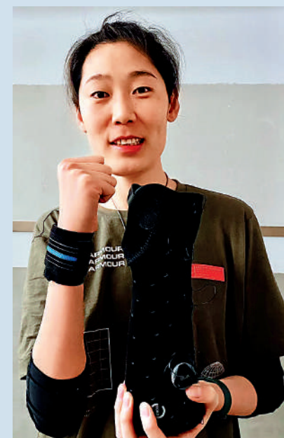
▲球迷們紛紛祝朱婷早日歸隊。

【大公報訊】據中新社報道：6日凌晨，中國女排球員朱婷時隔兩個月再度更新個人社交媒體。她晒出手術後的康復照片，並配文：「手術，石膏板，大護具，小護具，專注康復，感受進步。」照片中，朱婷的手腕從熱著石膏板，被厚厚的繃帶包裹，到僅被手腕護帶纏繞。手術成功後的朱婷，傷病恢復取得不小的進展。球迷們也紛紛在她的社交媒體下留言，希望她能早日歸隊。