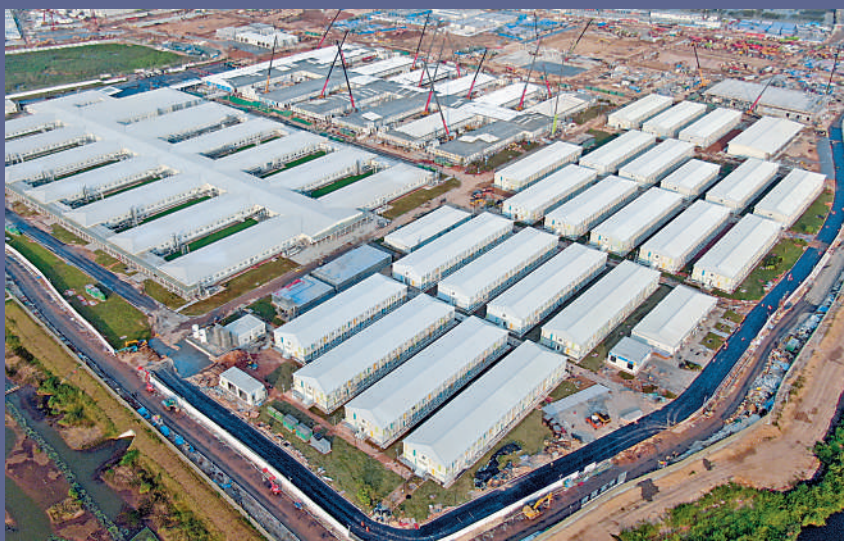
▲位於香港落馬洲河套地區的中央援港應急醫院項目一期工程按期完工。