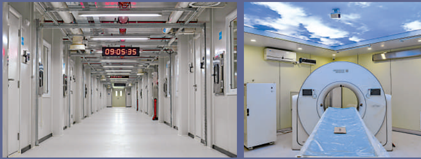
▲中央援港應急醫院一期內部。