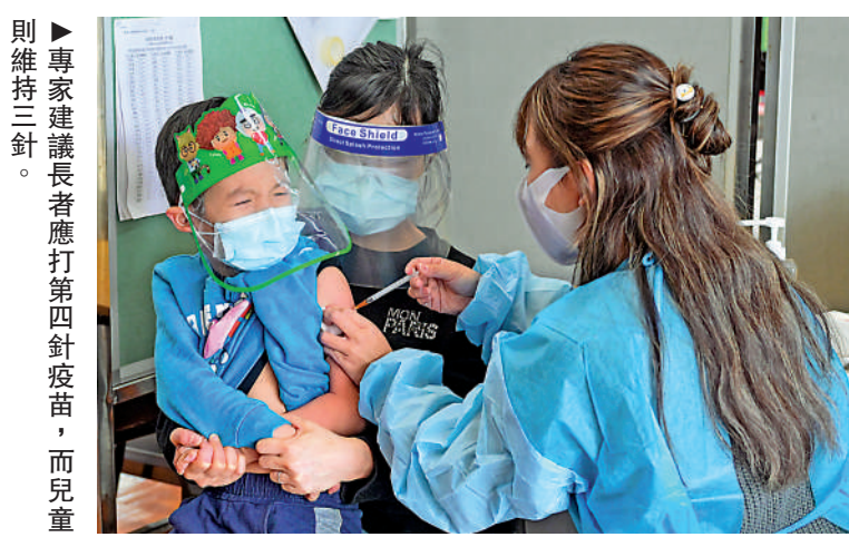
▶專家建議長者應打第4針疫苗，而兒童則維持三針。

此外，本港昨日新增2644宗確診個案，包括12宗輸入病例；死亡數字仍高企，再多97名患者離世，7宗為滯後個案。兩宗較年輕的死亡個案，包括一名27歲，患有長期哮喘的男性未轉陰性便出院，出院22日後在家暈倒，無心跳呼吸，搶救不治離世。另一名52歲乳癌擴散的女病人，3月12日首次發現染疫，前日在家中暈倒，送院不治，兩人均沒有疫苗接種紀錄。