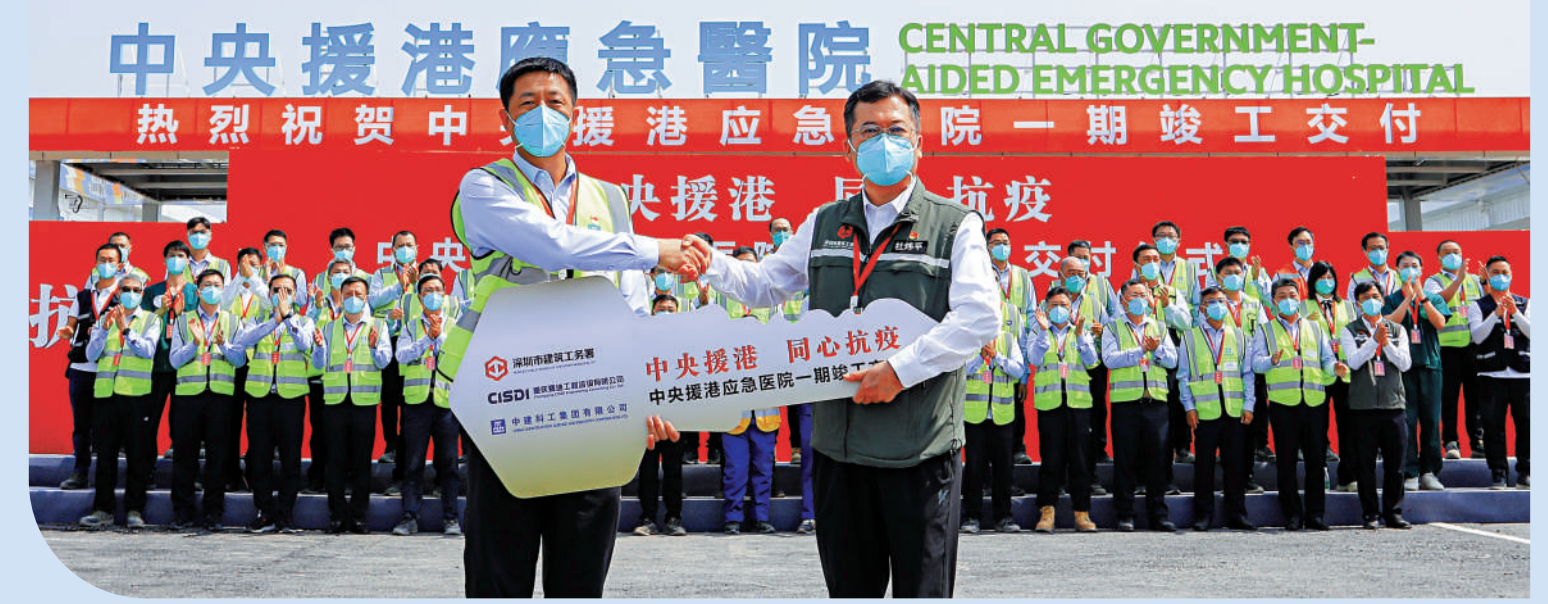
▲中央援港應急醫院項目一期昨日竣工交付。