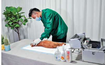
▲毛毛寵工作人員為寵物整理儀容。