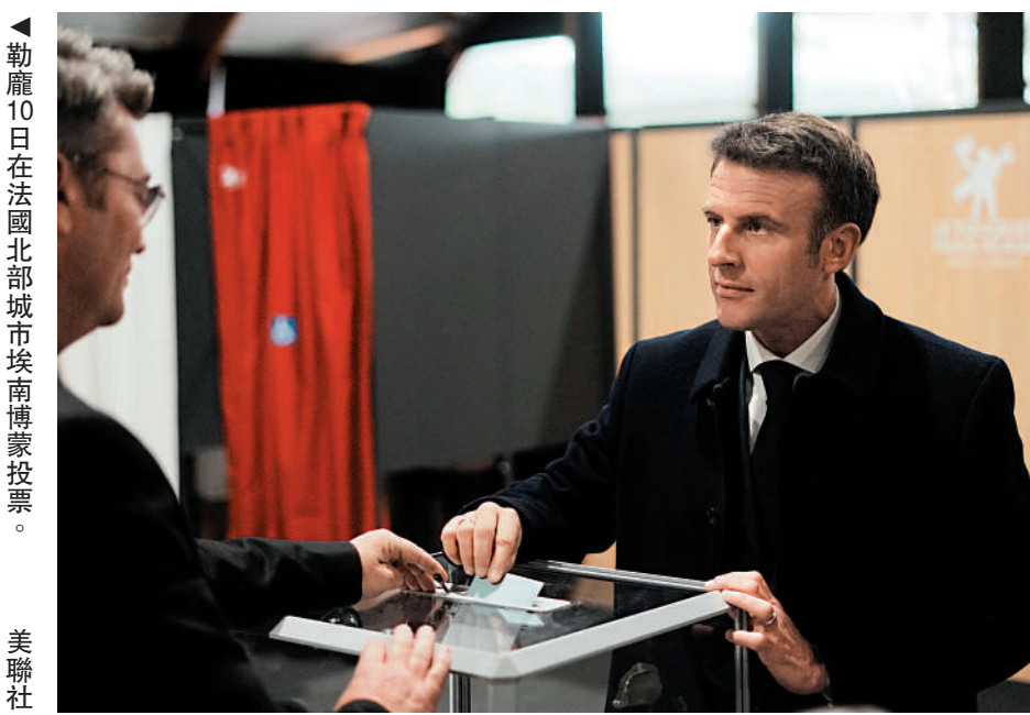
▲勒龐10日在法國北部城市埃南博蒙投票。