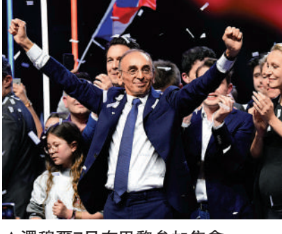
▲澤穆爾7日在巴黎參加集會。

澤穆爾於2021年11月30日在電視節目上宣布參選總統。在此之前，他當過記者、評論作家，也寫過書，將自己包裝成「歷史愛好者」和「才子」。他時常參與電視節目，並憑藉「直言不諱」的風格和帶有種族主義色彩的言論吸引公眾關注，尤其受到年輕人歡迎。在澤穆爾宣布參選前的一次民調中，他的支持率甚至超過勒龐，達到近20%，直接威脅到馬克龍。 值得注意的是，澤穆爾是阿爾及利亞猶太人的後代，他本人是法國移民政策的受益者，但他卻旗幟鮮明地反移民，並大肆宣揚反穆斯林思想。這導致