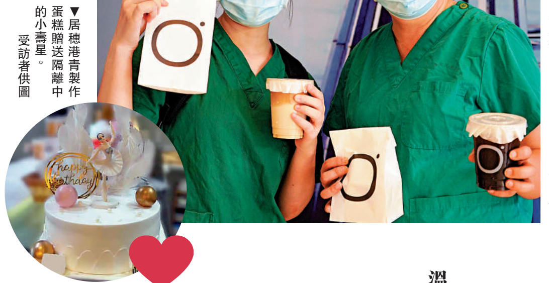
▼居穗港青製作蛋糕贈送隔離中的小壽星。