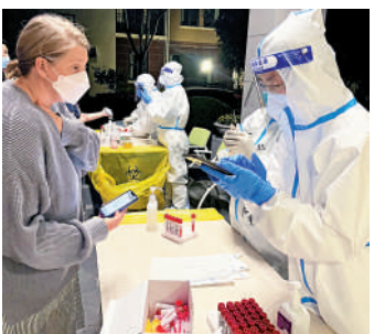
▲港人家幫助社區內的外國鄰居做核檢登記。