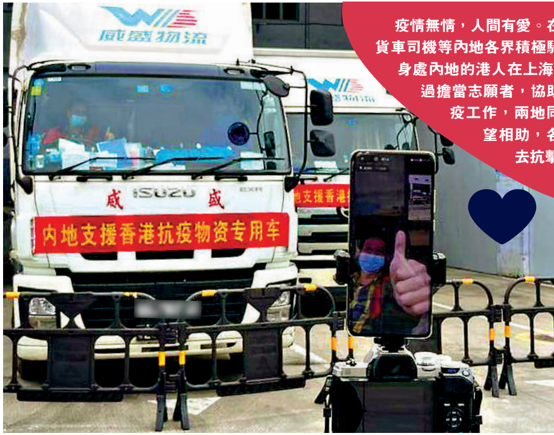
▶運送支援香港防疫物資應急車隊的跨境車輛日夜運作，對於司機們來講，車上就是「生活區」。

疫情無情，人間有愛。在香港疫情嚴峻之際，包括跨境貨車司機等內地各界積極馳援，保障香港物資供應；而身處內地的港人在上海、廣州出現疫情時，亦通過擔當志願者，協助派送物資等，支持抗疫工作，兩地同胞心手相連、守望相助，各自盡一分力去抗擊疫情。