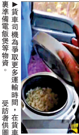
▶貨車司機為爭取更多運輸時間，在貨車裏準備電飯煲等物資。