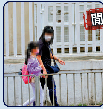
▲▶婦人帶着女孩離開診所，直接到超市購物。