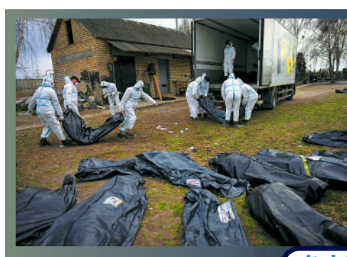
▲志願者12日將布查街頭的屍體放上貨車。