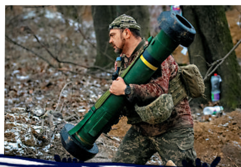
▲手持「標槍」反坦克導彈的烏克蘭軍人。路透社

路透社披露，當前，對烏克蘭「最有用的武器」包括「標槍」反坦克導彈和「毒刺」防空導彈。「標槍」由雷神和洛克希德馬丁公司聯合生產，而「毒刺」由雷神公司生產。