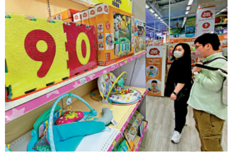
▲選購泡膠地墊要留神，避免孩子玩耍後攝入化學物質。

「Caraz」的供應商則不認同消委會所量度的平均厚度，並提供該塑膠袋的訂購要求規格，及近日由第三方實驗室檢測的該款塑膠袋測試結果，均顯示塑膠袋的厚度大於歐盟標準的要求。