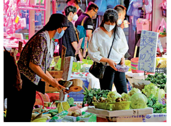
▲市民為慳錢趁街市收檔前「執平貨」。

立法會議員鄧家彪指出，一直以來不少居民都質疑超市逆市加價，並反映不少「打包」售賣的貨品，看似有優惠，但實際價格反而高於購買單件商品。他認為，超市在經濟低迷、百業蕭條時「賺到盡」，做法離譜，加重市民生活負擔。他留意到，疫情下，多了基層家庭要節衣縮食、買過期商品、在街市打烊時購買商家賣不出的平價蔬果。