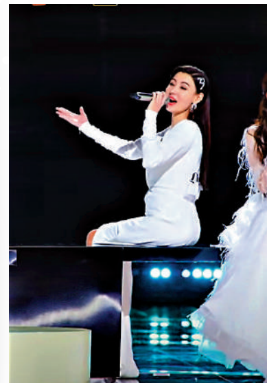
▲直拍是打歌舞台不可缺少的因素。圖為張柏芝《逆光》舞台直拍。

以韓國當前的音樂放送節目為例，一個標準的打歌舞台，除了需要藝人進行大量的唱跳練習、磨合，以及配合演出的舞台美術、舞台調度外，往往還有需要打光濾鏡、舞台直拍等元素，前前後後多次的綵排和預錄才能完成一個完整的舞台。儘管當前大大小小的晚會演出不少，但能夠達到打歌舞台的效果卻不多，而《乘风破浪的姐姐》、《披荆斬棘的哥哥》系列正為喜歡唱跳舞台的觀眾提供了這樣的演出。從這四個方面而言，該系列IP能夠在內地綜藝節目中一路乘風破浪、披荆斬棘，也就不奇怪了。