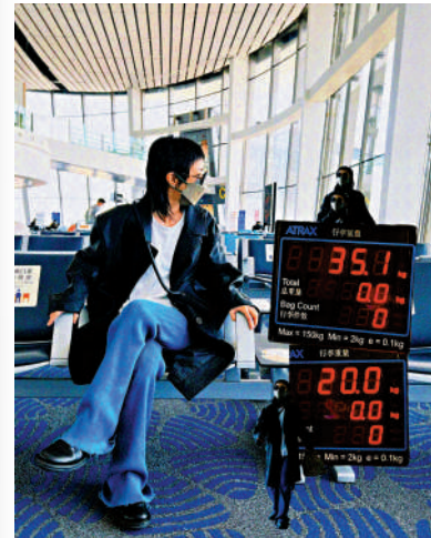
▲郭采潔在社交媒體晒出機場照片，並配文「前往一個濕度相對高的城市探險」。