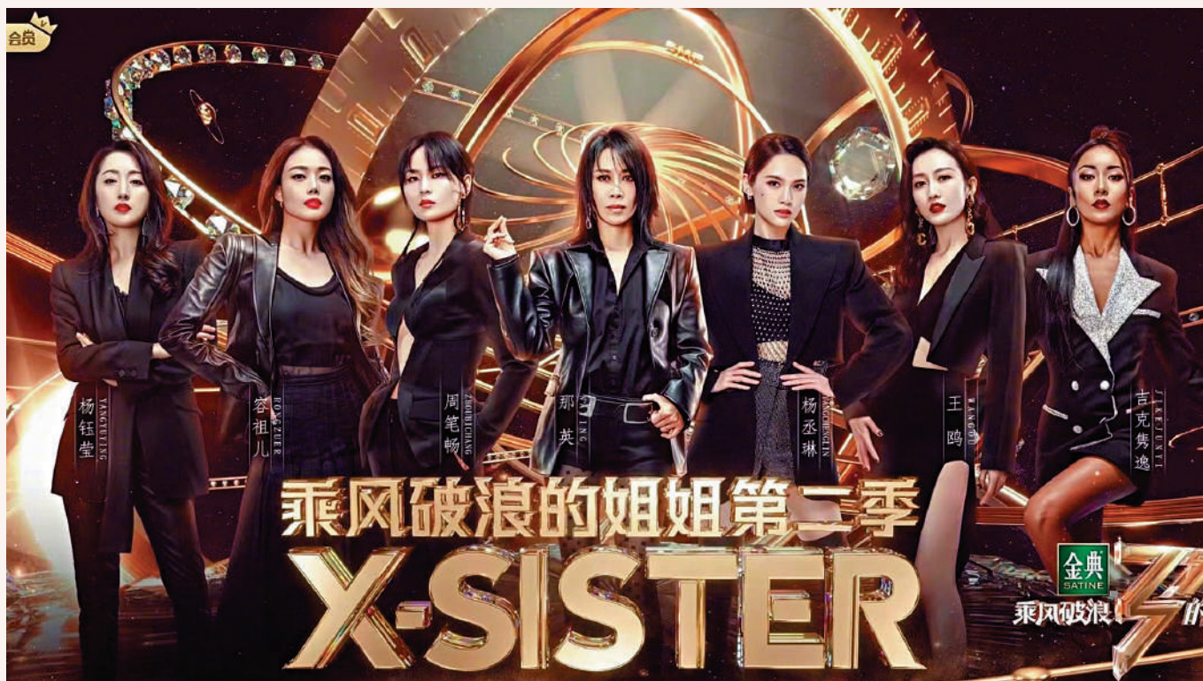
《乘风破浪的姐姐》系列是由芒果TV打造的熱門綜藝IP。