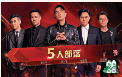
▲《披荆斬棘的哥哥》節目組成功打造了「大灣區哥哥」這個團體。

在選擇藝人方面，節目組既會邀請如陳松伶、趙文卓這樣過去以演員身份出現、形象比較正統、與「女團」、「男團」唱跳舞台有反差感的藝人，也會邀請一些「退隱江湖」已久的姐姐和哥哥，如楊鈺瑩、左小青等，他們更容易吸引大齡觀眾群體觀看節目，令其在節目中找尋共同回憶。