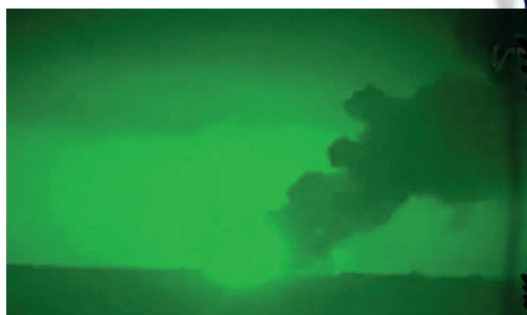
▲網傳「莫斯科」號爆炸冒煙影像，但有媒體核查指，這是2019年兩艘坦桑尼亞貨輪在刻赤海峽附近水域起火畫面。視頻截圖

【大公報訊】綜合美聯社、今日俄羅斯、《紐約時報》報道：俄羅斯國防部14日發布消息稱，俄黑海艦隊旗艦「莫斯科」號導彈巡洋艦發生火災，導致軍艦搭載的彈藥被引爆。俄方指，目前明火已被撲滅，雖然艦艇受損嚴重，但主要導彈武器未損壞，該艦仍處於漂浮狀態，正採取措施將艦隻拖入港口。烏克蘭方面則稱，烏軍兩枚部署在敖德薩的「海王星」反艦導彈命中「莫斯科」號，該艦已經下沉。