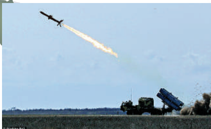
▲「海王星」導彈發射圖。

「海王星」是烏克蘭基於蘇聯X-35「天王星」導彈研發的一款反艦導彈系統，使用R-360巡航導彈。這一導彈系統由移動式指揮車、導彈運輸裝填車和發射車組成。