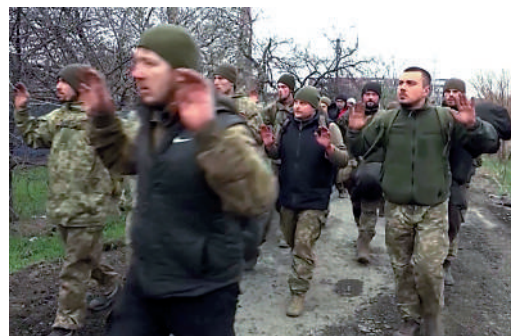
▲俄方發布馬里烏波爾守軍投降畫面。

馬里烏波爾已被俄軍包圍逾40天，自3月15日起，守城烏軍的補給就已被切斷。美國智庫華盛頓戰爭研究所（ISW）推測，俄軍可能本周內就可完全拿下馬里烏波爾。分析指，完全控制馬里烏波爾一直是俄軍的要務之一，為的是打通從烏東到南部克里米亞的通道。