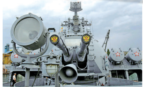
▲「莫斯科」號正面。