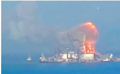
▲俄黑海艦隊「奧爾斯克」號登陸艦3月24日爆炸起火。