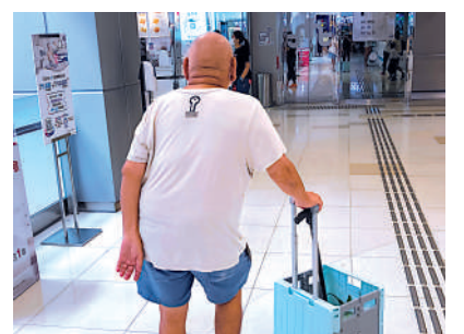
▲部分長者即使有需要，也不願意聘請外傭。