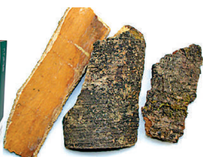
▲三冬茶其中一種成分是中藥「救必應」。