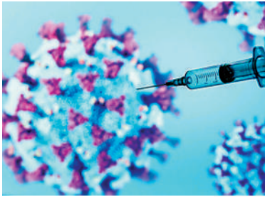
▲接種疫苗可降低感染新冠肺炎的風險。