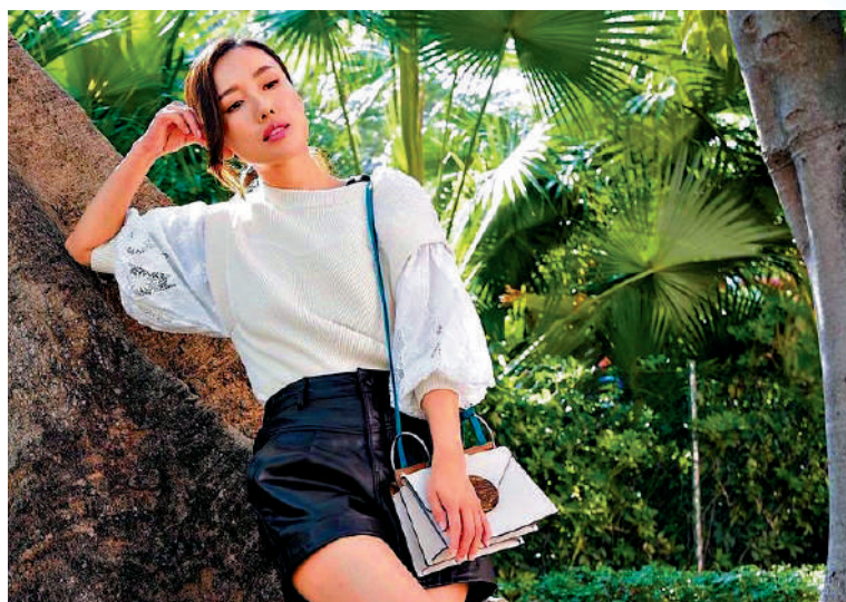
李施嬅近年受疫情影響，不少工作暫停。