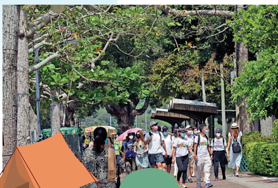
◀在西九龍海濱長廊欣賞海景。