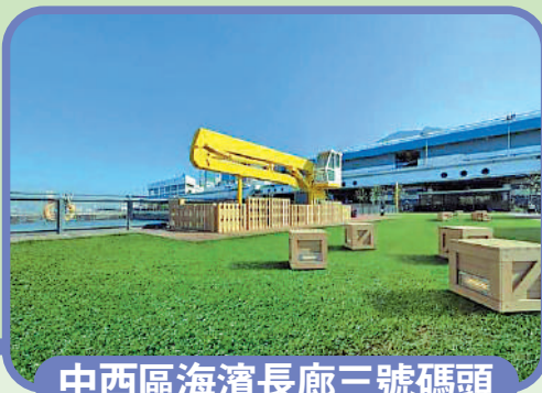
中西區海濱長廊三號碼頭