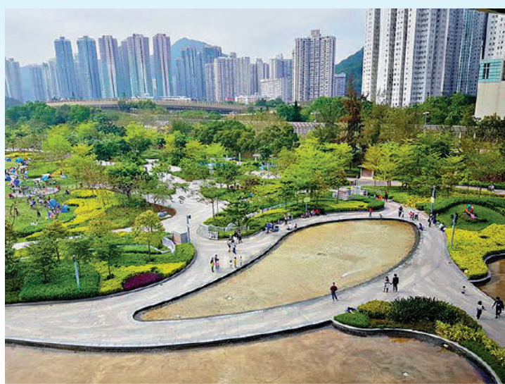
◀位於將軍澳的單車館公園一景。