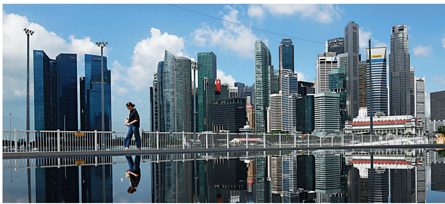
▲3月29日，新加坡市民在濱海灣行走。