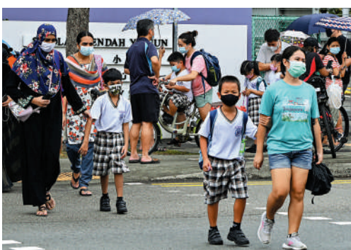
▲2021年5月，新加坡學童戴口罩上學。

2021年，新加坡批准PR的人數達到33400人之多，創下五年來的新高。報告指，隨着不滿的選民越來越多，新加坡執政黨必須在「保護本地人就業」和「對外開放」之間保持平衡。新加坡政府此前已採取多項措施鼓勵企業優先聘請本地人，包括逐步調高外國人申請工作簽證的薪資門檻，收緊外國人簽證配額，當中以金融、銀行和諮詢公司等行業受影響最大。