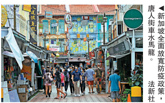
▲新加坡全面放寬防疫政策，唐人街車水馬龍。

醒孩子在離開房間時必須關掉所有的電器。 星展銀行高級經濟學家沙希 (Irvin Seah) 表示，新加坡很可能還會經歷兩年以上「高於正常水平」的通脹。他認為新冠疫情的反覆、國際局勢的緊張以及當地勞動力的緊缺將把新加坡的物價維持在高位，並預計新加坡今年通脹水平為3.8%，明年為3.2%，均高於過去13年2%的平均水平。