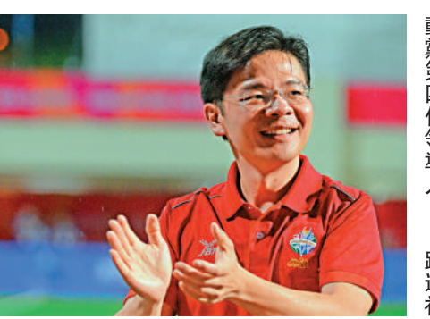
▲黃循財16日被推選為人民行動黨第四代領導人。

脹壓力帶領新加坡走向未來，是他將要面臨的又一重大挑戰。 另外，黃循財在本月16日至25日出訪美國，其間除了會到華盛頓特區及紐約會見當地政府官員，還會參加國際貨幣基金組織 (IMF) 和世界銀行的春季會議，以及二十國集團 (G20) 第二次財長及央行行長會議。黃循財還將與紐約商界領袖以及當地新加坡人會面。